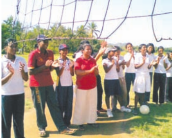
සතුටින් ක්‍රීඩා නරඹමු 7.9 රූපය

ඉහත ගති ගුණවලින් සමන්විත වන විට ඔබ ක්‍රීඩකත්වය හා බැඳුණු සමාජයීය ලක්ෂණ සංවර්ධනය කර ගත් අයකු වෙයි.