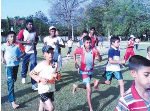
7.3 රූපය සාමූහික ව සෙල්ලම් කරමු

පාසල් සිසුවකු සිසුවියක වන ඔබ ද තම දක්ෂතාව මත ඉහත ක්‍රියාකාරකම්වලට ඉදිරිපත් වී ඇත. එහි දී නීති රීති හා පිළිගැනීම්වලට අනුව ක්‍රියා කිරීමේ අත්දැකීම් ද බහුල ව ලබා ඇත.