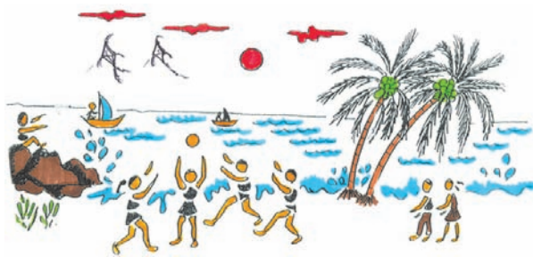
7.5 රූපය මුහුදු වෙරළේ සෙල්ලම් කරන ළමයි