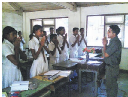
7.2 රූපය ගුරුතුමා පන්තියට පැමිණෙන විට ආචාර කරන ළමයි