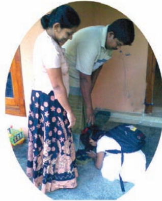
7.1 රූපය දෙමව්පියන්ට වැද නිවසින් පිටත් වන දරුවා