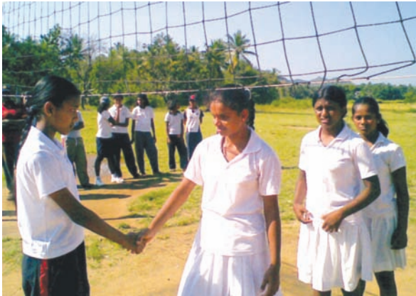
7.7 රූපය තරඟ අවසානයක සමුගැනීමක්

තමා හෝ තම කණ්ඩායම සමඟ තරඟ වදින්නේ, තමා මෙන් ම වූ ක්‍රීඩකයන් මිස විරුද්ධවාදීන් නොවන බව සැමවිට ම සිහි තබා ගත යුතු ය. එසේ ම ඔවුන් සමඟ පහත දැක්වෙන ආකාරයට කටයුතු කළ යුතු ය.