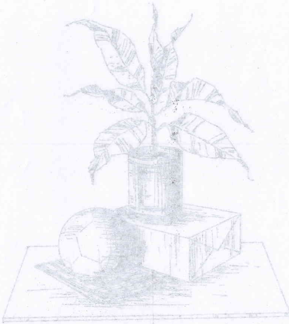
Figure 11 - 01