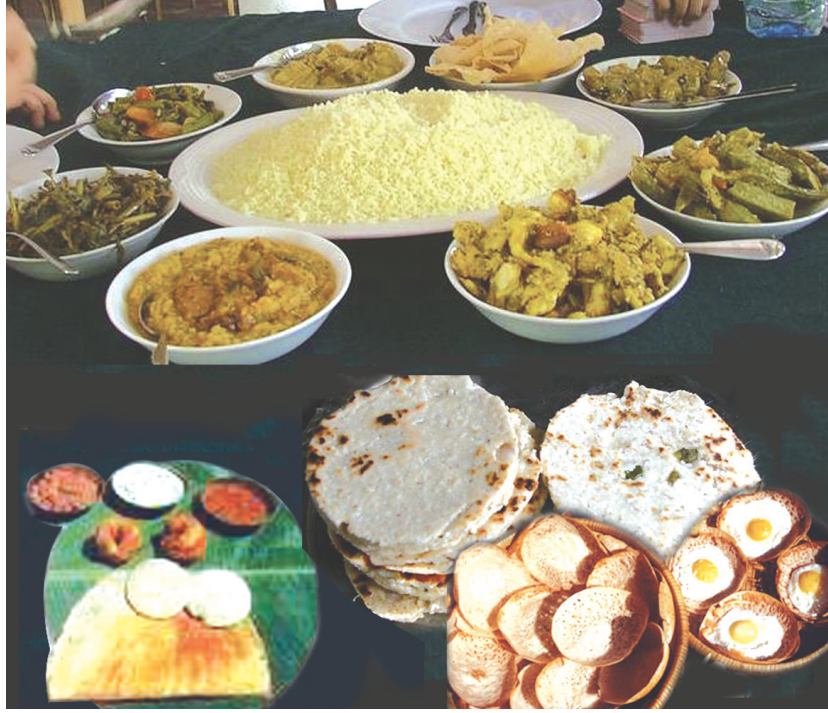
உரு 3..7 பல்கலாசாரத்திற்குரிய உணவுவகை

எமது தேசிய விளையாட்டு குழுக்களில் அனைத்துக் கலாசாரங்களையும் சேர்ந்த வீரர்கள் காணப்படுகின்றனர்.