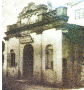
யாழ்ப்பாணம் வண்ணார் பண்ணையில் அமைந்த வித்தியாநுபாலன அச்சகம்