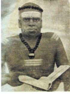
நாவலரது திருவுருவப் படம்