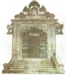
சிதம்பரத்தில் அமைந்த சைவப்பிரகாச வித்தியாசாலை