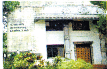
நாவலர் கலாசார மண்டபம்