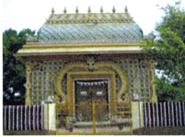
நல்லூர் நாவலர் மணிமண்டபம்