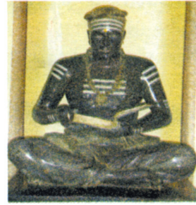
நாவலர் நூற்றாண்டு விழாவின் போது உருவாக்கப்பட்ட நாவலர் சிலை