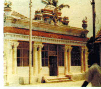
யாழ்ப்பாணம், வண்ணார் பண்ணையில் அமைந்த சைவப்பிரகாச வித்தியாசாலை