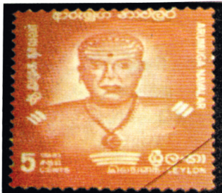
நாவலரைக் கௌரவித்து 1971 ஆம் ஆண்டு வெளியிடப்பட்ட முத்திரை