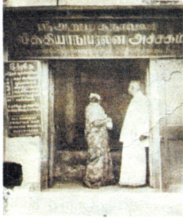
சென்னையில் அமைந்த வித்தியாநுபாலன அச்சகம்