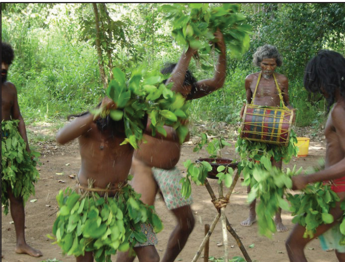
உரு 11.3 வேடர் சமூகத்தின் சமய நடனம்