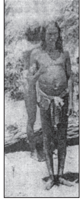
பிவிருபொல்லே பெத்தேயில்இஉள்ள வேடுவத் தலைவன்