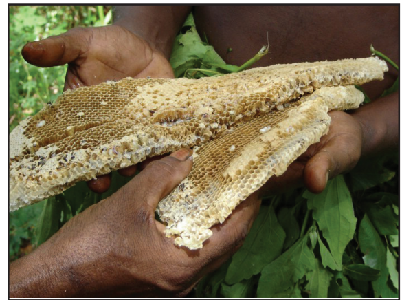
உரு 11.4 வேடர் சமூகத்தின் அதிவிருப்பமான உணவான தேனும் தேன் வதையும்