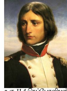
உரு 11.4 நெப்போலியன் பொனபாட்

நெப்போலியன் கி.பி. 1797 ஆம் ஆண்டு வட இத்தாலியில் லொம்பாடி, ஜெனோவா, நேப்பிள்ஸ் ஆகிய பிரதேசங்களை அங்கிருந்த ஆட்சியாளர்களைத் தூரத்தியே கைப்பற்றிக் கொண்டார். கி.பி 1807 ஆம் ஆண்டு பாப்பரசரின் கீழ் இருந்த இத்தாலியப் பிரதேசத்தைப் பெற்று “வட இத்தாலி” என்ற அரசை ஆரம்பித்து அதன் அரசனாக முடி சூடிக்கொண்டான். அவனது தலைநகராக மிலான் விளங்கியது. பின்னர் சிசிலிப் பிரதேசத்தையும் இணைத்துக் கொண்டான்.