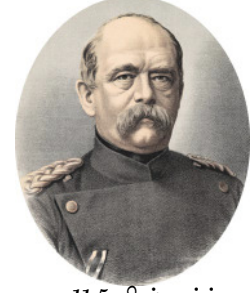
உரு 11.5 பிஸ்மார்க்

இதனால் லிபரல்வாத ஐக்கிய ஜேர்மனியின் பொருட்டு தேசிய சபையொன்று அனைத்து ஜேர்மன் அரசுகளினதும் பிரதிநிதிகள் 500 பேரின் பங்குபற்றுதலுடன் நடைபெற்றதுடன் அது பிரான்பாட் பாராளுமன்றம் எனப்பட்டது. பல்கலைக்கழகப் பேராசிரியர்கள், சட்டத்தரணிகள், நீதிபதிகள், குருமார் ஆகியோர் அதில் பிரதிநிதித்துவம் வகித்தனர். ஆஸ்திரியா உட்பட ஜேர்மன் அரசுகள் மகாஜேர்மனி (Great Germany) என அறிமுகமானது. பிரஷ்யா உள்ளடங்கிய பகுதி சிறிய ஜேர்மனி (Little Germany) எனப்பட்டதுடன், சிறிய ஜேர்மனி என்ற எண்ணக்கரு பிரான்பாட் பாராளுமன்றத்தில் கலந்துரையாடலில் இடம் பெற்று தடைப்பட்டுப்போனது.