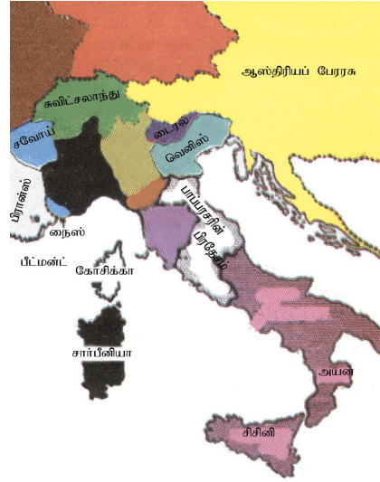
தேசப்படம் 11.1 இத்தாலிய ஐக்கியம்

மத்திய காலத்தில் இத்தாலி பல சிற்றரசுகளாகச் சிதறிக் கிடந்தது. அந்த அரசுகளிடையே அதிகாரப் போட்டி நிலவியது. அவ்வாறே ஐரோப்பாவில் இருந்த பலம் வாய்ந்த அரசுகள் இத்தாலியின் பிரதேசங்களைத் தமது ஆட்சியின் கீழ் வைத்திருந்தன. உதாரணமாக சிசிலி, நேப்பிள்ஸ் என்பன ஸ்பானியாவின் கீழ் இருந்தன. பர்மா, மொடினா, டஸ்கனி, வெனிஸ் முதலான நகரங்கள் ஆஸ்திரியாவின் கீழும் மத்திய இத்தாலி பாப்பரசரின் கீழும், வேறு சில பகுதிகள் பிரபுக்களின் கீழும் இருந்தன.