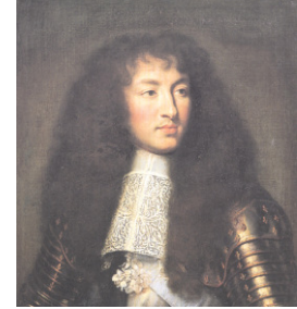
உரு 11:1 14 ஆம் லூயி மன்னன்.

பிரான்சின் முடியாட்சி சர்வாதிகாரமாக உருவெடுத்ததுடன் பழங்காலம் முதல் இருந்து வந்த மக்கள் பிரதிநிதிகள் நிறுவனமான ஸ்டேட் ஜெனரல் கூட்டப்படவில்லை. இவைகளும் பிரான்சியப் புரட்சிக்குக் காரணங்களாயின. ஸ்டேட் ஜெனரல் என்ற பிரான்சிய பாராளுமன்றம் குருமார், பிரபுக்கள், சாதாரண மக்கள் என்போரைக் கொண்டதாக இருந்தது. இந்தச் சபை கி.பி 1614 ஆம் ஆண்டின் பின்னர் கூட்டப்படாமையானது அரசன் இதனைப் புறக்கணித்தமையைக் காட்டுகிறது. முடியாட்சி, அதிகாரத்தைக் குவித்துக் கொண்டதால் பிரதேச நிர்வாக நடவடிக்கைகள் ஸ்தம்பிதம் அடைந்தன. இதனால் எழுந்த சீர்கெட்ட நிர்வாகம், பிரான்சியப் புரட்சிக்குக் காரணமாகியது.