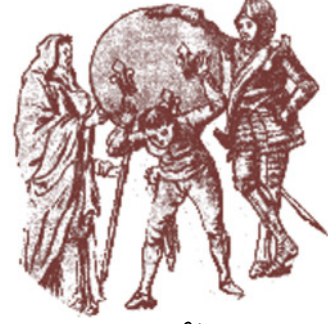
உரு 11.3 வரிச்சுமை

3. கி.பி 1786 ஆம் ஆண்டு இங்கிலாந்துடன் செய்து கொள்ளப்பட்ட ஈடன் உடன்படிக்கையின் காரணமாகப் புடைவை இறக்குமதி மீதான இறைவரி நீக்கப்பட்டது. இங்கிலாந்தில் உற்பத்தியின் பொருட்டு இயந்திரம் உபயோகப்படுத்தப்பட்டதால் உற்பத்திச் செலவு குறைந்தது. எனவே பிரான்சின் சிறு கைத்தொழில் உற்பத்திகள் அவற்றுடன் போட்டியிட முடியவில்லை. இதனால் பிரான்சின் உற்பத்தி ஸ்தம்பிதம் அடைந்தது.