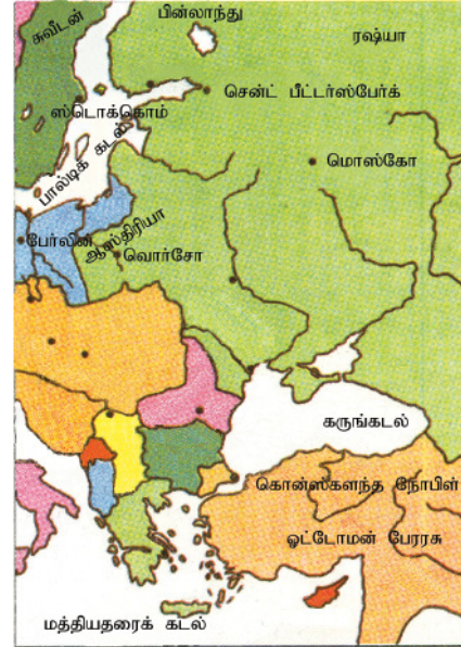
தேசப்படம் 11.3 ரஷ்யாவின் ஆதிக்கப் பரம்பல்

கி.பி 1900 ஆம் ஆண்டளவில் ஐரோப்பாவில் ஏற்பட்ட கைத்தொழில் நெருக்கடி ரஷ்யாவிலும் பரவியதால் 3000 தொழிற்சாலைகள் மூடப்பட்டன. விவசாயிகள், தொழிலாளர்கள், இளைஞர்கள் ஆகியோர் பேரரசுக்குக் கரும் எதிர்ப்பைத் தெரிவித்தனர். வேலை நிறுத்தும் உச்ச நிலையை அடைந்தது. கருங்கடலில் கடற்படையினரும் கிளர்ச்சியில் இணைந்து கொண்டனர். துருக்கியும், பிரான்சும் ரஷ்யாவுடன் நல்ல மன நிலையில் இருக்கவில்லை. கி.பி. 1905 ஆம் ஆண்டு ஐப்பான் -ரஷ்ய யுத்தத்தில் ரஷ்யா தோல்வியடைந்தமையும் பொது மக்களின் ஆர்ப்பாட்டம் அதிகரிக்கக் காரணமாகியது. மன்னரிடம் சென்ற ஊர்வலமொன்று துப்பாக்கிச் சூட்டுக்கு இலக்கானதுடன் டிரொஸ்கி உட்படத் தலைவர்கள் சிறைப்பிடிக்கப்பட்டுக் கிளர்ச்சி அடக்கப்பட்டது.