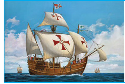
உரு 8.1 கிறிஸ்தோபர் கொலம்பஸின் கப்பல்

ஐரோப்பியர்களுள் நாடுகாண் பயணங்களில் முதலில் ஈடுபட்டவர்கள் போர்த்துகேய ஸ்பானிய நாட்டவர்களாவர். ஸ்பானியர்கள் அத்திலாந்திக் சமுத்திரத்தினூடே மேற்குத் திசையில் பயணித்து மத்திய, தென் அமெரிக்காவின் பல பிரதேசங்களைக் கண்டறிந்தனர். கி.பி 1492 இல் கிறிஸ்தோபர் கொலம்பஸால் மேற்கிந்தியத் தீவுகள் கண்டறியப்பட்டன. அதற்கு ஸ்பானிய மன்னனின் உதவி கிடைத்தது.