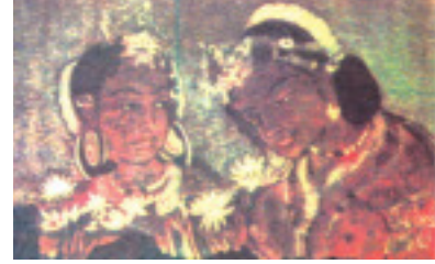
உரு 2.6 அஜந்தா ஓவியம்