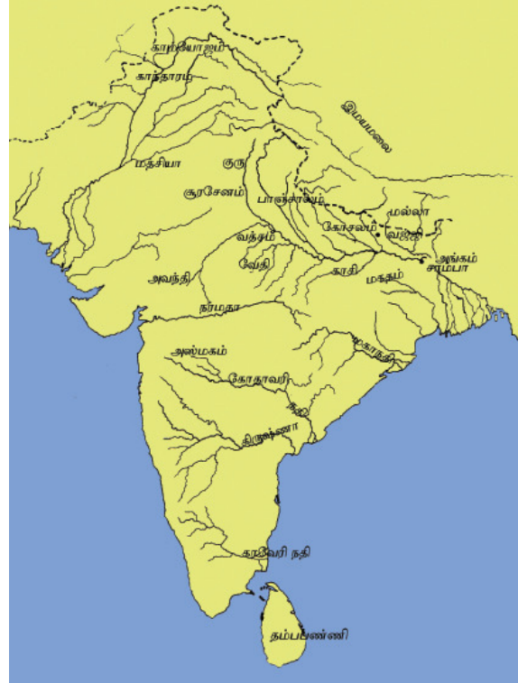
தேசப்படம் 2.1 பதினாறு பெருங்குடியிருப்புகள்

இந்த அரசுகளின் நிர்வாக முறை ஒன்றுக்கொன்று வேறுபட்டிருந்தன. உதாரணமாக அரசுகளில் குடி, சங்க என்ற ஆட்சிமுறைகள் நிலவின. இந்த பதினாறு அரசுகளில் மகதம், கோசலம், வத்சயம், அவந்தி என்பன அரசியல் ரீதியில் முக்கியத்துவம் பெற்று விளங்கின. வஜ்ஜி, மல்லா என்பன குடி அரசுகளாக இருந்தன. இவைகளில் செல்வந்த வர்க்கத்தினரின் ஆதிக்கம் காணப்பட்டது. வஜ்ஜி, மல்லா ஆகிய அரசுகளுக்கு வடமேற்கே கோசல அரசும், தென்கிழக்கே மகத அரசும் அமைந்திருந்தன. முக்கிய முடியரசான கோசலம், மகதம் ஆகிய இரண்டிலும் மகதம் சிறப்பாகப் பிற்காலத்தில் எழுச்சியுற்றது.