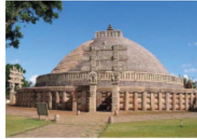
உரு 2.2 சாஞ்சி தூபி