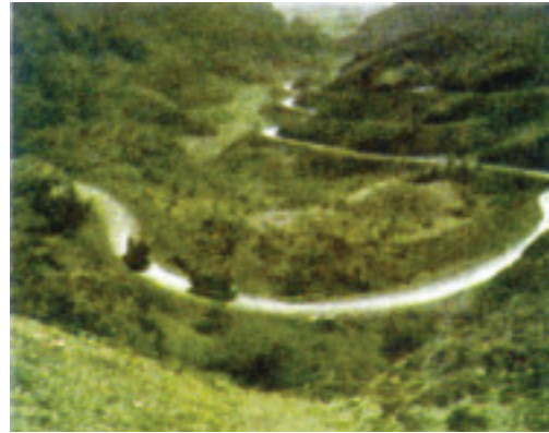
உரு 2.1 கைபர் கணவாய்

ஆரியரின் பூர்வீக இடம் பற்றி வரலாற்றாய்வாளர்களிடையே பல்வேறு கருத்துக்கள் நிலவுகின்றன. பலரின் கருத்துப்படி ஆரியரின் பூர்வீக இடம் மத்திய ஆசியாவில் அமைந்த ஸ்டெப்ஸ் புல் நிலமாகும். இங்கு வாழ்ந்த மக்களில் ஒரு பகுதியினர் ஐரோப்பாவை நோக்கியும் மற்றைய பகுதியினர் இந்தியாவையும் ஈரானையும் நோக்கியும் குடிபெயர்ந்தனர். மத்திய ஆசியாவிலிருந்து கைபர் கணவாய் வழியாக இந்தியாவுக்கு வந்த ஆரியர் இந்தியாவில் சிந்துநதிப் பள்ளத்தாக்கை அண்மித்த தற்போதைய பஞ்சாப் பிரதேசத்தில் முதன்முதலில் குடியேறினர்.