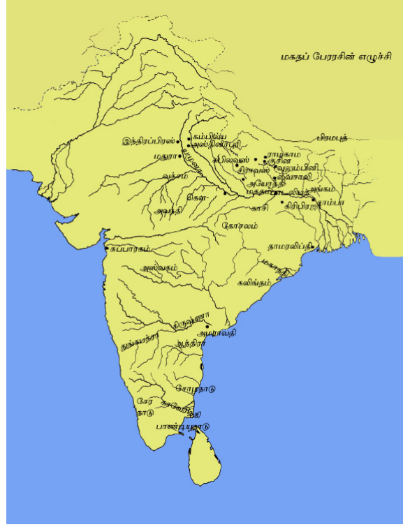
தேசப்படம் 2.2 மகதப்பேரரசு

வடஇந்தியாவில் முக்கிய அரசாக விளங்கிய மகதம், நந்தர்களின் ஆட்சியின் கீழ் மேலும் வளர்ச்சியுற்றது. இதன் ஆரம்ப ஆட்சியாளன் மகா பத்மநந்தன் என்பவனாவான். நந்தர் பரம்பரையின் முக்கியமான இறுதி ஆட்சியாளனான தனநந்தனின் காலத்தில் வட இந்தியாவில் பரந்த நிலப்பரப்பில் பரவியிருந்த ஒரு பேரரசாக மகதம் விளங்கியது.