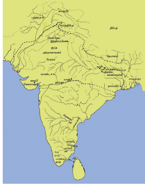
தேசப்படம் 2.4 குப்தப் பேரரசு

இந்துகுஷ் மலைத்தொடருக்கு அப்பால் போரிட்டு வெற்றி கொண்டதால் இந்தியாவுக்கு வெளியிலும் பேரரசின் எல்லையை விஸ்தரிக்க இரண்டாம் சந்திரகுப்தனால் முடிந்தது. அவன் விவாகத் தொடர்புகள் மூலம் நாடுகளை இணைத்ததையும் காணக்கூடியதாக உள்ளது.