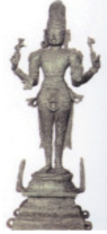
உரு 2.4 சிவன்