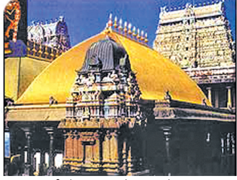
சிதம்பர நடராஜர் ஆலயம்