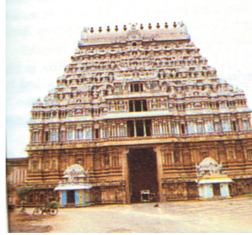
திருவாரூர் தியாகராஜ சுவாமிகள் ஆலயம்