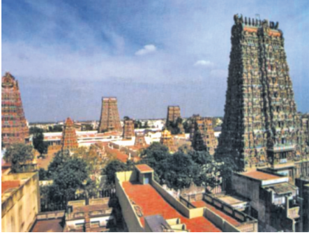
மதுரை மீனாட்சி அம்மன் ஆலயம்