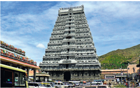
திருவண்ணாமலை அருணாசலேஸ்வரர் ஆலயம்