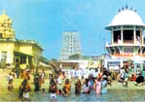
அக்கினித் தீர்த்தமும் இராமேஸ்வர ஆலயமும்