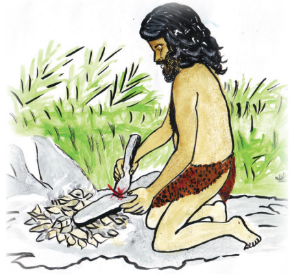
2.2 රූපය - ගින්දර නිපදවීම

එනම්, ගල් යුගයේ සිටි ආදිවාසීහු වැස්සෙන් ආරක්‍ෂා වීම සඳහා නිවාස ලෙස ගල් ගුහා තෝරා ගත්හ. සතුන්ගේ ඇටවලින් හෝ ගල්වලින් ආයුධ සාදා ගැනීමට පුරුදු වූහ. මේ ආයුධ යොදා ගෙන ආහාර පිණිස සතුන් දඩයම් කළහ. සත්ව හම්, ගස්වල කොළඅතු භාවිත කර සිරුර වසා ගැනීමෙන් දැඩි සීතලෙන් හා හිරු රශ්මියෙන් ආරක්‍ෂා වූහ. මෙසේ ඔවුන්ගේ ජීවන රටාව ක්‍රම ක්‍රමයෙන් වෙනස් විය.