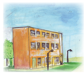
2.3 රූපය - නිවාස අවශ්‍යතාව ක්‍රමයෙන් වෙනස් වීම