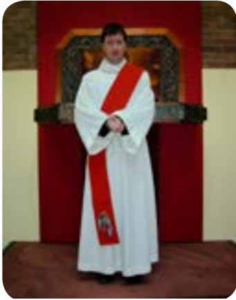
படம் 11.8 - திருத்தொண்டர்