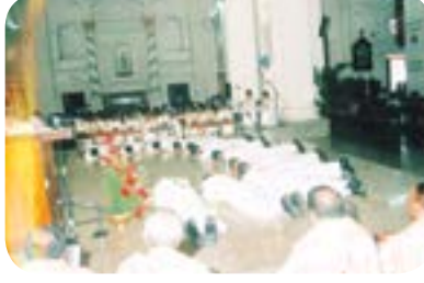
படம் 11.2 - முகங்குப்புற விழுந்து செபித்தல்