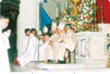
படம் 11-1 - குருத்துவ வார்த்தைப்பாடு அளித்தல்