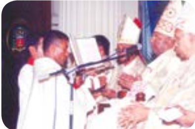
படம் 11.6 - கிறிஸ்மா தைலத்தால் கைகளை அருட்பொழிவு செய்தல்