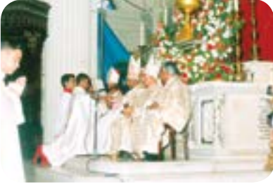
படம் 11.4 - அர்ப்பண செபம்