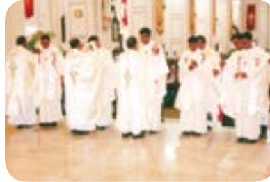
படம் 11.5 - திருப்பலி உடை அணிவித்தல்