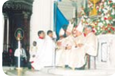
படம் 11.7 - அப்பத்துடன் கிண்ணமும் இரசத்துடன் கலமும் அளித்தல்

மேல் காணும் படங்களில் உங்கள் கவனத்தைச் செலுத்துங்கள். குருத்துவ அருளடையாளங்களை வழங்கும் சடங்கின் முக்கிய நிகழ்வுகள் இவற்றில் காட்டப்படுகின்றன. குருத்துவத்தை அளிப்பவர் ஆயர் ஆவார். அவர் திருத்தொண்டரின் தலை மேல் கைகளை வைத்துச் செபித்து குருத்துவத்தை அளிப்பார்.