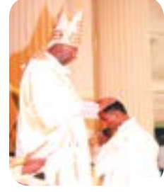
படம் 11-3 - தலையில் கை வைத்துச் செபித்தல்