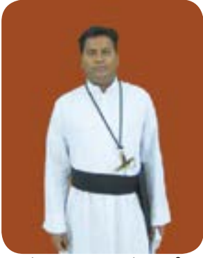
படம் 11.9 - அருட் பணியாளர்