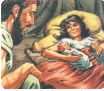
படம் 8.1 - யாக்கோபுவின் பிறப்பு