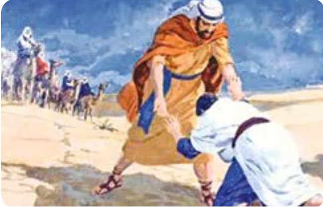
படம் 8.4 யாக்கோபு ஏசாவை வணங்குதல்