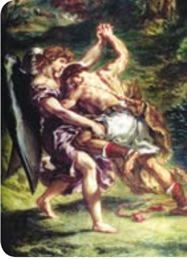
8.3 படம் - பெனியேலில் காட்சி

யாக்கோபு ஆரானில் வாழ்ந்து, மீண்டும் வாக்களிக்கப்பட்ட நாட்டிற்கு வந்தார். அவ்வாறு வரும்போது ஓர் ஆடவர் பொழுது விடியும்பொழுது அவரோடு மற்போரிட்டார். யாக்கோபுவை வெற்றி கொள்ள முடியாது என்று கண்ட அந்த ஆடவர் அவரது தொடைச் சந்தைத் தொட்டார். அப்போது யாக்கோபுவின் தொடைச் சந்து விலகியது. பொழுது புலரப்போவதால் தன்னைப் போக விடுமாறு அந்த ஆடவர் யாக்கோபுவிடம் கூற, “நீர் எனக்கு ஆசி வழங்கினாலொழிய உம்மைப் போக விடேன்” என்று கூறினார்.