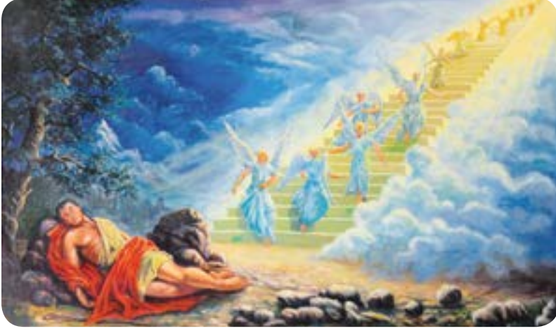
படம் 8.2 - பெத்தேலில் கனவு