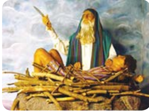
படம் 7.2 - ஆபிரகாம் ஈசாக்கைப் பலியிடுதல் (தொ.நூ 22 :1 -19)

ஆபிரகாம் - சாராவுக்கு ஈசாக் பிறந்தபோது ஆபிரகாமின் வயது 100. சாராவுக்கு 90 வயது(தொ. நூ 17 : 17). ஆண்டவரால் செய்ய முடியாதது ஒன்றும் இல்லை என்பது இதன் மூலம் காட்டப்படுகிறது. அதனால் நாம் ஆண்டவரில் முழு நம்பிக்கை வைக்க வேண்டும். நம்பிக்கையுடன் செபிக்க வேண்டும். ஈசாக் என்ற பெயரின் கருத்து “சிரித்தல்” என்பதாகும். ஈசாக்கும் ஓர் குலமுதுவராவார்.