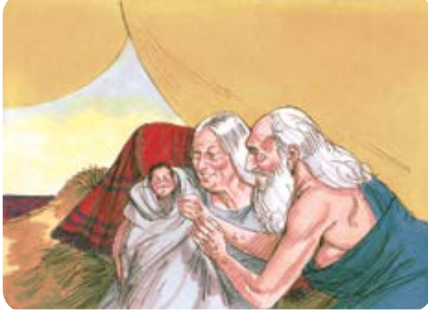
படம் 7.1 - ஈசாக்கின் பிறப்பு