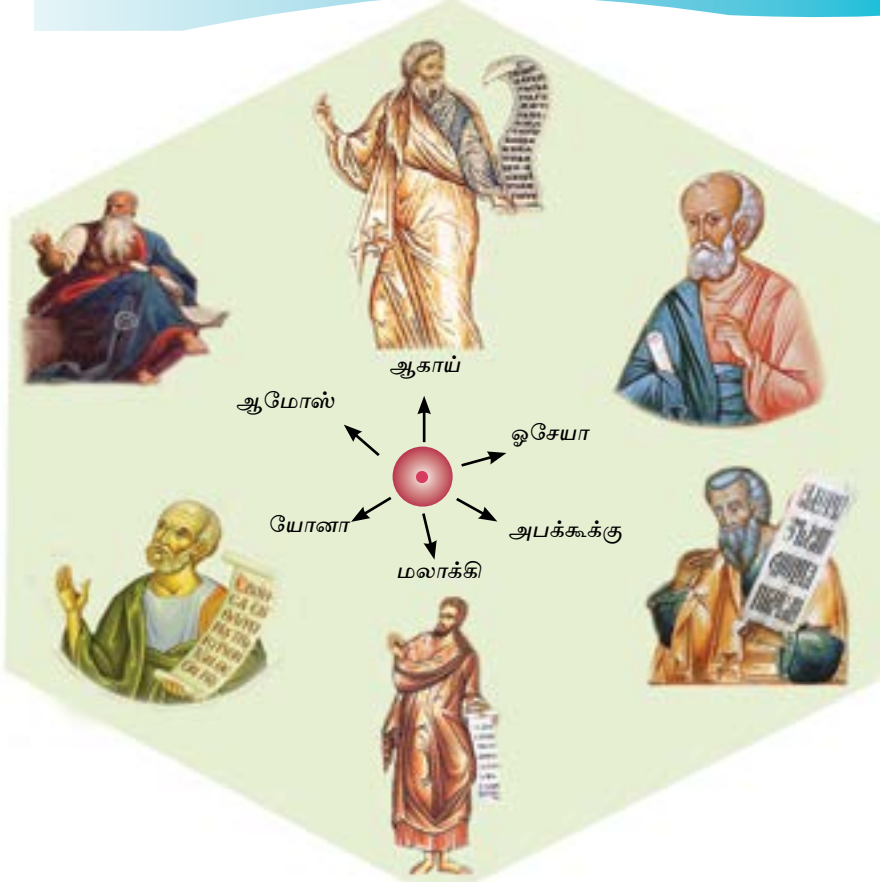
படம் 4.1 - சிறிய இறைவாக்கினர்

இப்படத்தில் சிறிய இறைவாக்கினர் சிலரை நீங்கள் காணலாம். இறைவனின் செய்தியை மக்களிடம் கொண்டு செல்வது இவர்களின் கடமையாகும். இதன்படி சமூகத்தில் இடம்பெறுகின்ற அநியாயங்கள், ஊழல் நிறைந்த ஆட்சி, ஒழுக்கத்துக்கு மாறான செயல்கள், மக்களின் பாவ வாழ்க்கையினால் வரப்போகின்ற அழிவு, உண்மையான மனமாற்றத்தின் அவசியம், இறைவனுடன் ஒன்றிணைதலின் அவசியம், தார்மீக வாழ்வின் முக்கியத்துவம் என்பனவற்றை இவர்கள் மக்களுக்கு எடுத்துக் கூறினர். இறைவாக்கினர்கள் வரலாற்றில் பல்வேறு காலகட்டங்களில் தவறான வழிகளில் சென்ற இஸ்ரவேல் மக்களை இறைவன் பக்கம் திருப்புவதன் வழியாக சரியான வழியில் செல்வதற்கு வழிகாட்டினார்கள்.