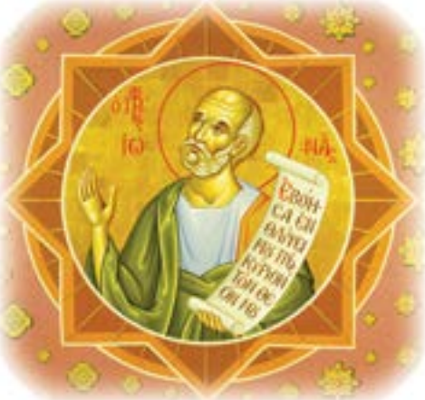
படம் 4.4 - இறைவாக்கினர் யோனா

இறைவாக்கினர் யோனாவும் கி.மு. 5 ஆம் நூற்றாண்டில் வாழ்ந்த இன்னு மொரு இறைவாக்கினராவார். இஸ்ரவேலுக்கு எதிரானவர்கள் வாழ்ந்த நினைவேக்குச் சென்று அங்குள்ள மக்களை மனமாற்றத்துக்கு அழைப்பதே