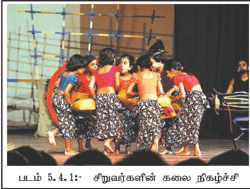
படம் 5.4.1:- சிறுவர்களின் கலை நிகழ்ச்சி

இரசனை என்பது சுவையை இனங்காணும் அறிவாற்றலாகும். அதாவது