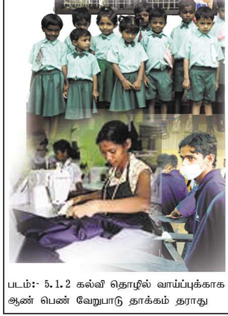
படம்:- 5.1.2 கல்வி தொழில் வாய்ப்புக்காக ஆண் பெண் வேறுபாடு தாக்கம் தராது

இரண்டாவதாக நடைமுறையிலுள்ள சமமின்மை விமர்சனத்துக்குள்ளாகும் பல்வேறு நிகழ்ச்சிகளை ஊடகங்களில் முன்வைக்கலாம். ஊடகப் பிரதிநிதித்துவங்களை ஆராயும் போது உண்மையில் ஊடகங்கள் என்ன செய்கின்றன என்பது பற்றிய உங்களது தீர்ப்பை நீங்கள் வழங்க வேண்டும்.