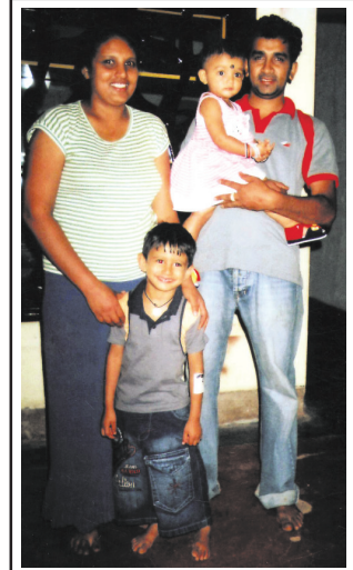
படம்:- 5.1.1 குடும்ப கட்டமைப்பு

குடும்பத்தில் சமூகமயமாக்கல் செயற்பாடு நடைபெறுவது தொடர்பில் நடத்தைக் கோட்பாடு முக்கியத்துவம் வாய்ந்தது. அது தூண்டற் துலங்களில் தங்கியுள்ளது. அதாவது குடும்பச் சூழலில் அதன் உறுப்பினர்கள் குழந்தைக்கு வழங்கும் தூண்டல் மற்றும் குழந்தையின் செயற்பாடு குறித்துக் குடும்பத்தின் அங்கத்தவர்களின் துலங்கல் என்பதே இதன் மூலம் விளக்கப்படுகிறது.