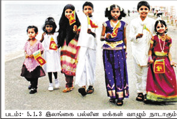
படம்:- 5.1.3 இலங்கை பல்லின மக்கள் வாழும் நாடாகும்

இனத்துவம் என்பது சமூகக் கட்டமைப்பில் உள்ள ஓர் இயற்கையான அங்கமாகும். சமூகம் முன்னேற்றமடையும் போது இனத்துவத்தை விஞ்சி குடியரிமை எண்ணக்கருவாக அது மாறும். எவ்வாறாயினும் உலகில் வாழும் ஒவ்வொருவரும் தனது இனத்துவம் பற்றிய பெருமிதத்துடன் அதனை மதிக்கவும் ஏனையவர்களின் இனத்துவம் பற்றி மதிக்கவும் சமூகம் பழக்கப்படல் வேண்டும். எவருக்கும் தான் சார்ந்த இனம் பற்றியும் கலாசாரம் பற்றியும் ஒரு பெருமிதத்தை