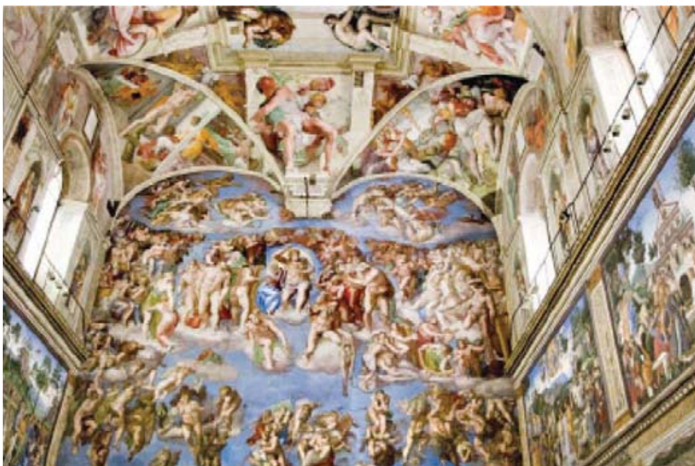
உரு 3.8 மைக்கல் ஆஞ்சலோவால் சிஸ்டைன் ஆலயத்தில் வரையப்பட்ட ஓவியம்

உரோமில் சிஸ்டைன் ஆலயப் பாவுகையில் அவரால் வரையப்பட்ட ஓவியம் அவரது சிறந்த கலைப்படைப்பாகும். இறுதித் தீர்ப்பு எனும் அவரது மற்றுமொரு ஓவியமும் சிறந்ததொன்றாகக் கருதப்படுகிறது.