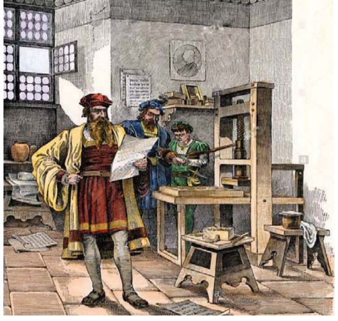
உரு 3.2 ஜோஹன்னஸ் கூடன்பேர்க்கும் மற்றும் அவரது அச்ச இயந்திரமும்

நிலவி வந்த செல்வாக்கான யுகம் முடிவுற்றது. அதன் பின்னரான ஆயிரம் ஆண்டுகள் (கி.பி. 500 - 1500) ஐரோப்பாவின் மத்திய காலம் என அழைக்கப்படுகிறது.