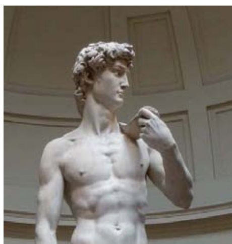
உரு 3.10 மைக்கல் ஆஞ்சலோவினால் நிர்மாணிக்கப்பட்ட டேவிட் சிலை