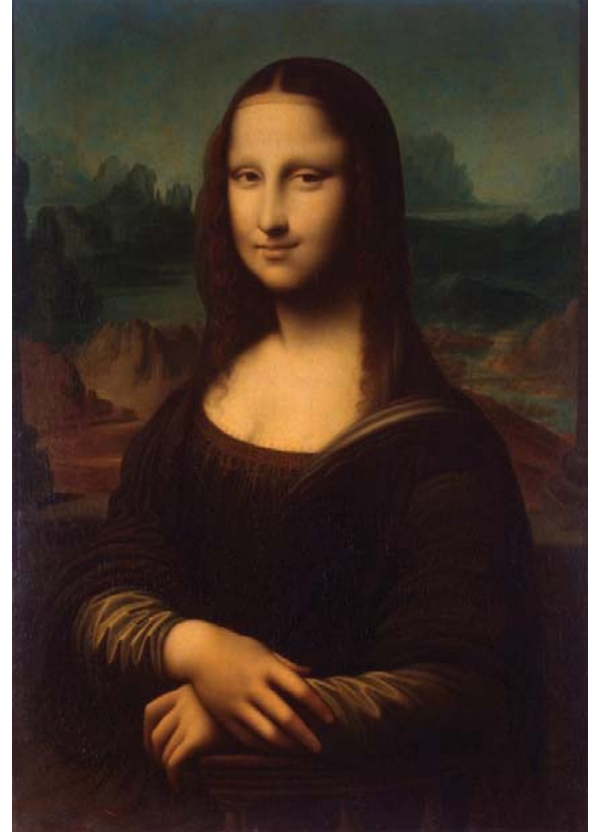
உரு 3.4 மோனாலிசா

சித்திரம் மறுமலர்ச்சிக் காலத்தில் பாரிய மாற்றங்களுக்கு உள்ளான கலையாகும். இத்தாலியில் புளோரன்ஸ் நகர் புதிய கலைகளின் தோற்றத்தின் மத்திய நிலையமாகியது. இதுவரை சமய ரீதியில் முக்கியத்துவம் வாய்ந்த கிறிஸ்துநாதர், கன்னிமரியாள் என்போரைக் கருப் பொருளாக வைத்து வடிவமைக்கப்பட்ட சித்திரங்களுக்குப் பதிலாக லெளகீகத்திற்கு முக்கியத்துவம் அளித்து சித்திரங்கள் தோற்றம் பெறுவதை மறுமலர்ச்சிக் காலத்தில் காணக் கூடியதாக இருந்தது. உரு 3.4 இல் காணப்படும் சித்திரத்தை நீர் முன்னர் கண்டதுண்டா? இவ்வாறான அற்புத சித்திரங்களை வரைந்த கலைஞர்கள் மறுமலர்ச்சிக் காலத்தில் தோற்றம் பெற்றனர். நாம் அவ்வாறான கலைஞர்கள் சிலரைப் பற்றியும் அவர்களது கலைப்படைப்புகள் பற்றியும் கற்போம்.