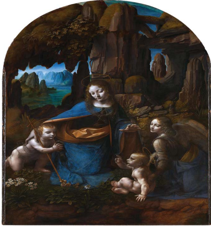
உரு 3.6 லியனாடோ டாவின்சியால் வரையப்பட்ட மற்றுமொரு சித்திரம்