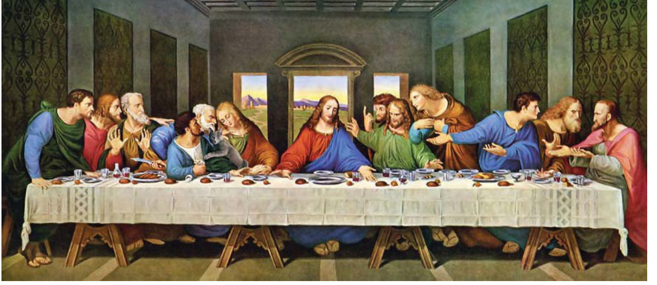
உரு 3.3 இறுதி இராப்போசனம்