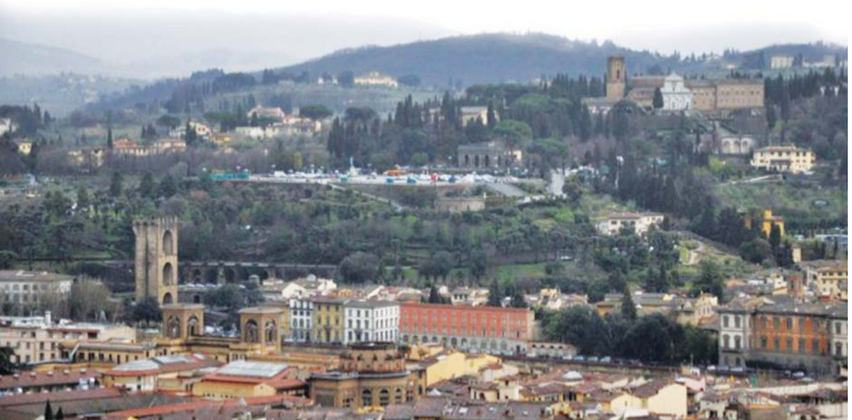
உரு 3.1 இத்தாலியின் நகரம் ஒன்று

ஐரோப்பாவில் புராதன காலத்தில் உயர் நிலையில் இருந்த கிரேக்க, உரோம நாகரிகம் பற்றி தரம் 7 இல் நீங்கள் கற்றுள்ளீர்கள். கி.பி. ஐந்தாம் நூற்றாண்டில் உரோம நாகரிகம் வீழ்ச்சியடைந்ததும் அதுவரை ஐரோப்பாவில்