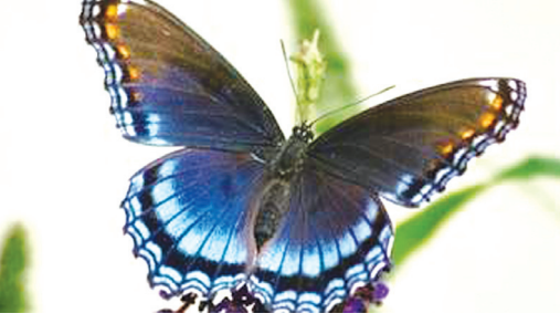
வண்ணத்துப் பூச்சியைப் போன்று புது வாழ்வை வாழ்தல்

பழைய வாழ்வில் இறைவனுக்கு விருப் பமில்லாத செயல்களை கைவிட்டு கிறிஸ் துவுக்குப் புதுவாழ்வு வாழ்பவர்களை வண்ணத்துப் பூச்சிக்கு ஒப்பிடலாம்.