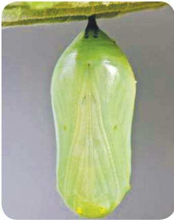
கூட்டுக்குள் புது வாழ்வுக்கு ஆயத்தமாகும் கூட்டுப்புழு

இதை கிறிஸ்துவில் புதுவாழ்வு ஆரம்ப மாவதற்கு முன் நாம் வாழும் வாழ்வு புழுவுக்கு சமமானதாகும்.