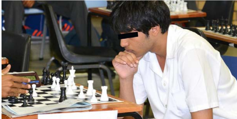
உரு 19.1 செஸ் விளையாட்டில் ஈடுபடல்

வாழ்க்கையின் சில சந்தர்ப்பங்களில் விரைவாகத் தீர்மானம் மேற்கொள்ள வேண்டிய நிலை ஏற்படும். இவ்வாறான சந்தர்ப்பங்களில் வெற்றிகரமாக முகங்கொடுப்பதற்கு ஆக்கத்திறன் மற்றும் ஆராய்வுச் சிந்தனை ஆகிய திறன்கள் முக்கியமானதாக அமையும்.