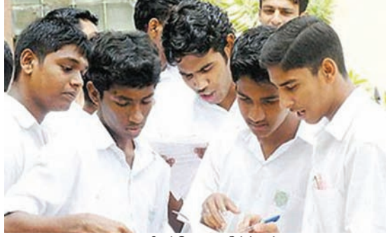
உரு 19.2 பிரச்சினை தீர்த்தல்

மேலேகூறிய உதாரணம் நாம் ஒவ்வொருவரும் முகங்கொடுக்கக்கூடிய பிரச்சினைக்குரிய சந்தர்ப்பமாகும். குடும்ப அங்கத்தவர்கள் அனைவரும் ஒன்று சேர்ந்து பொருத்தமான முடிவுகளுக்கு வருவதன் மூலம் இவ்வாறான சந்தர்ப்பங்களுக்கு வெற்றிகரமாக முகங்கொடுக்கலாம்.