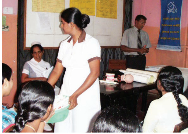
உரு 20.4 சுகாதாரப் பிணியாய் சேவைகளில் பங்கேற்றல்