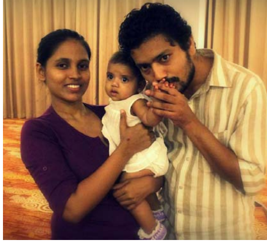
உரு 20.6 பிள்ளைக்கு அன்பு, அரவணைப்பைப் பெற்றுக் கொடுத்தல்