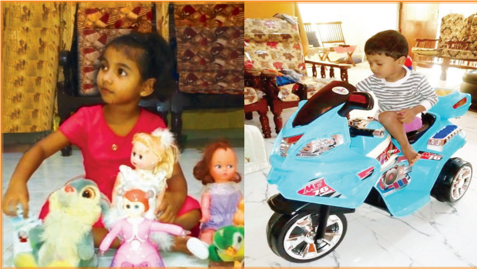
உரு 20.1 பால்நிலையின் அடிப்படையில் விளையாட்டுப் பொருள்களின் வகை