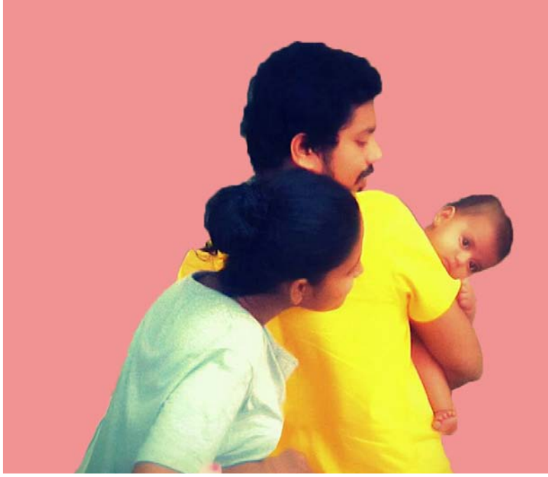
உரு 20.2 பால்நிலை வேறுபாடு பாராது செயல்களில் ஈடுபடல்