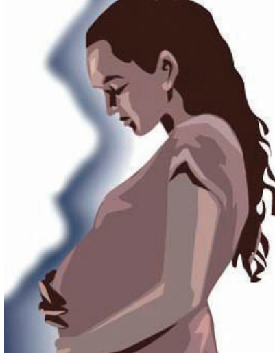
உரு 20.3 எதிர்பாராத கர்ப்பம் தரித்தல்