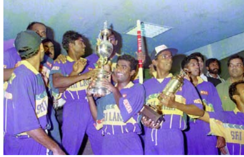
உரு 2.2 விளையாட்டில் வல்லவராகுதல்

உங்களிடமுள்ள திறமைகளில் ஒன்று அல்லது பலவற்றை மேம்படுத்துவதன் மூலம் அவற்றில் நீங்கள் தேர்ச்சி பெற்றவராகலாம் என்பதில் ஐயமில்லை. இவ்வாறான உள்ளார்ந்த திறன்கள் ஒவ்வொருவரிடமும் உள்ளன. எங்களிடம் உள்ள உள்ளார்ந்த திறன்களுக்கு அமைய குறிப்பிட்ட இலக்கொன்றை இனங்கண்டு பிறருக்குப் பாதிப்பை ஏற்படுத்தாத வகையில் அதனை எய்துவதற்கு முயற்சி செய்யுங்கள். இதன்மூலம் உங்களிடத்தே திருப்தி, மகிழ்ச்சி, சுயகௌரவம் ஆகியன ஏற்படும். இவையனைத்தையும் ஒருங்கே சேர்ந்து சுயதிறனியல் நிறைவு என எளிதாகக் கூறிக் கொள்ள முடியும்.