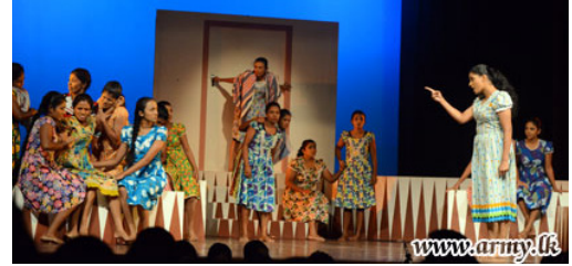
உரு 2.1 அழகியற் திறன்கள்