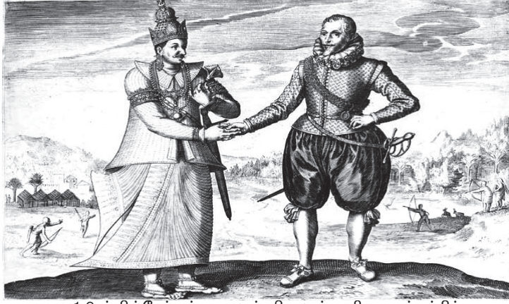
உரு. 1.2 ஸ்பில்பேர்ஜன் முதலாம் விமலதர்மசூரியனைச் சந்தித்தமை