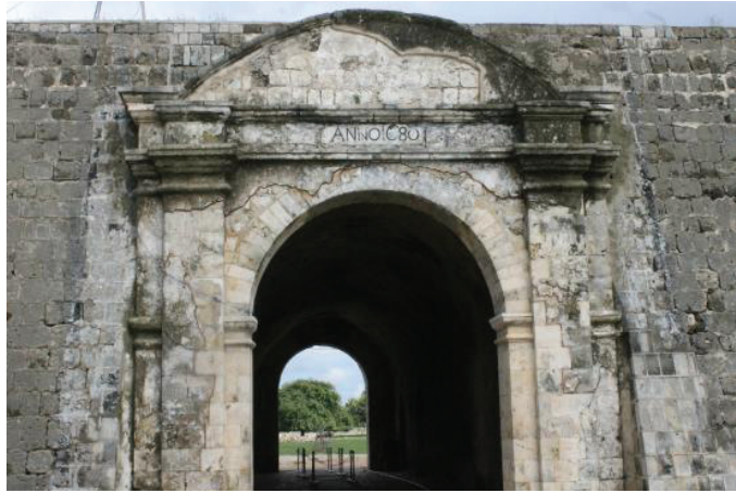
உரு 1.4 யாழ்ப்பாணக் கோட்டை

கைப்பற்றப்பட்ட கோட்டைகளை ஒல்லாந்தர் தாமேவைத்துக்கொண்டனர். போர்த்துக்கேயரிடமிருந்து கைப்பற்றிய பிரதேசங்களில் தமது அதிகாரத்தை நிலை நாட்டுவதே ஒல்லாந்தரின் நோக்கம் என்பதை விளங்கிக்கொண்ட மன்னன், ஒல்லாந்தரது ஆட்சிப் பிரதேசத்தைக் குறைப்பதற்கான உபாயமொன்றை மேற்கொண்டான். அதன்படி