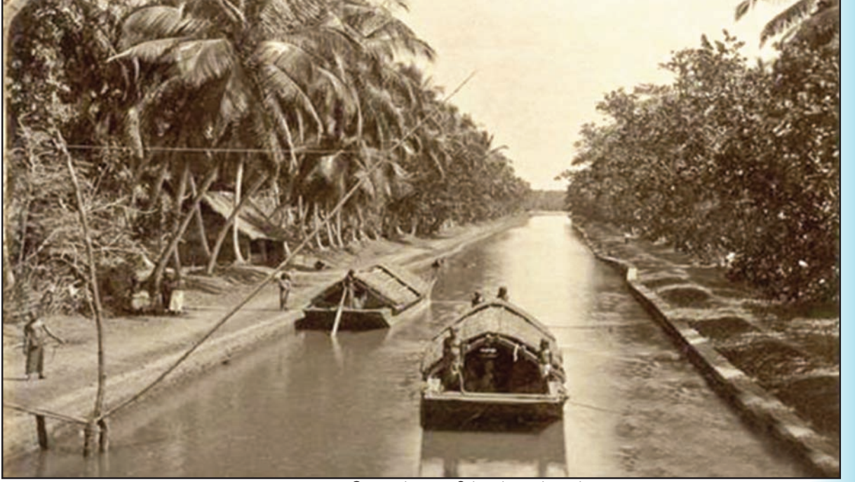
உரு 1.7 கொழும்பு ஹமில்டன் கால்வாய்