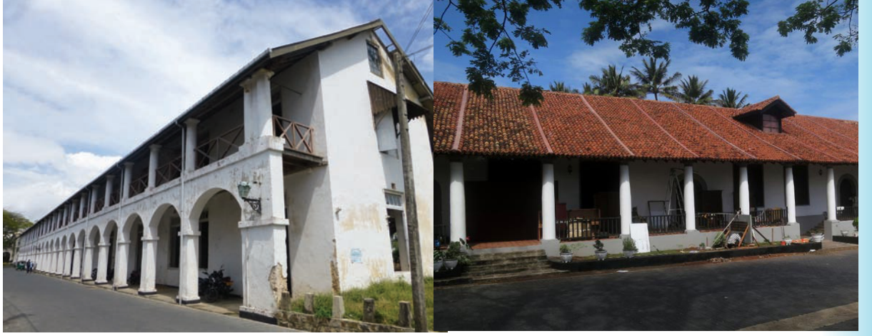
உரு. 1.8 இலங்கையில் ஒல்லாந்தரது கட்டடக் கலை