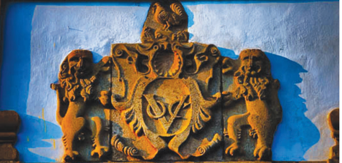
உரு 1.1 கீழைத்தேச ஒல்லாந்த வர்த்தக சங்க (VOC) இலச்சினை

போர்த்துக்கேயர் ஆசியாவுக்கு வந்து ஒரு நூற்றாண்டு காலம் வரை கடல்வழித் தொடர்பான விளக்கத்தை ஐரோப்பியர் தெரிந்து கொள்வதைத் தடைசெய்வதற்கான நடவடிக்கைகளை அவர்கள் மேற்கொண்டனர்.