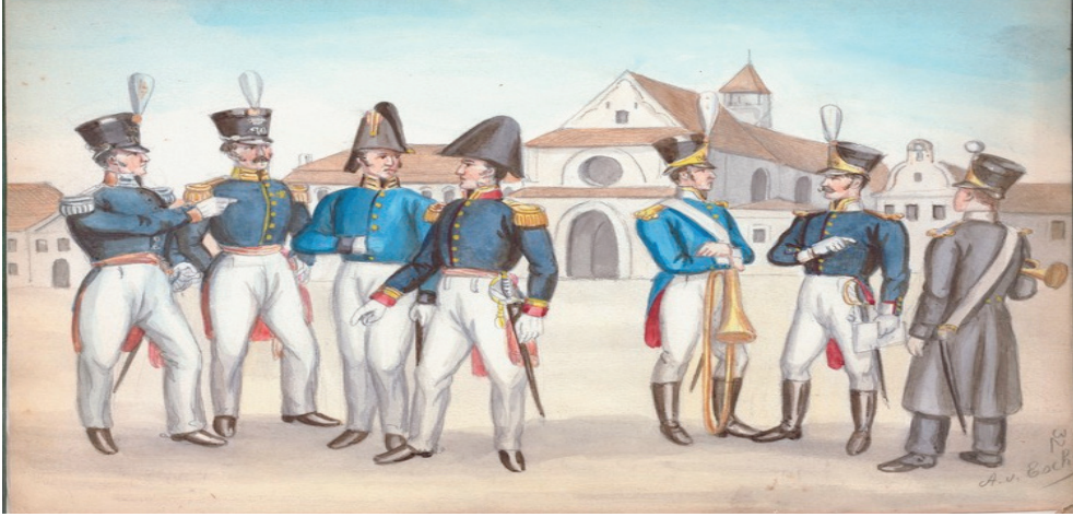
உரு. 1.6 ஒல்லாந்துப் படைவீரர்களின் தோற்றம்

பிரதேசத்திற்கு மீண்டனர். இந்தத் தோல்வியின் பின்னர் அதிக நாட்கள் செல்வதற்குள் 1765 ஆம் ஆண்டு ஒல்லாந்தரால் மீண்டும் கண்டி இராசதானி ஆக்கிரமிக்கப்பட்டது. இந்த ஆக்கிரமிப்பில் இரு சாராருக்கும் பலத்த சேதங்கள் ஏற்பட்டன. 1765 ஆம் ஆண்டு பெப்ரவரி மாதம் ஒல்லாந்தர் கண்டி நகரை அடைந்ததால், மன்னன் பாதுகாப்பிற்காக ஹங்குரன்கெத்த என்ற இடத்திற்குத் தப்பிச் சென்றான். கண்டி நகரைக் கைப்பற்றிய ஒல்லாந்தர் முன்வைத்த நிபந்தனைகளை ஏற்றுக்கொள்ள மன்னன் இணங்கவில்லை. மழைக்காலம் தொடங்கியதும் நோய்களால் பாதிக்கப்பட்டும் கண்டி மக்களின் தாக்குதலாலும் ஒல்லாந்தர் மீண்டும் திரும்பிச் சென்றனர்.