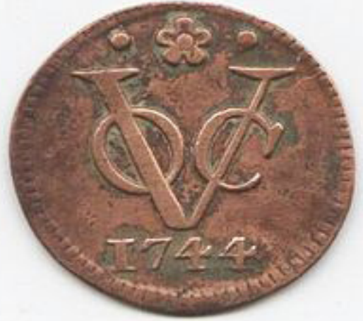
உரு 1.9 ஒல்லாந்தரின் பீங்கானும் நாணயமும்