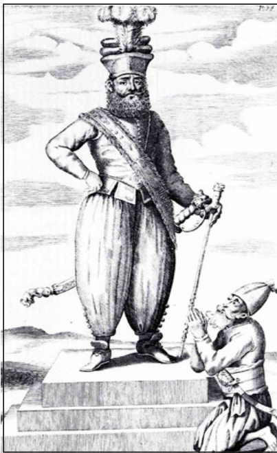
உரு 1.5 இரண்டாம் இராஜசிங்க மன்னன்

முதலாம் விமலதர்மசூரிய மன்னனது காலந்தொடக்கம் கண்டி இராசதானிக்கும் ஒல்லாந்தருக்கும் இடையே தூதுத் தொடர்பு நிலவியது. இரண்டாம் இராஜசிங்க மன்னனது காலத்தில் குறைந்தது எட்டுப் பேராவது இடையிடையே மன்னனைச் சந்தித்துள்ளனர். இரண்டாம் இராஜசிங்க மன்னனது காலத்தில் நடைபெற்ற தூதுப் பயணங்களில் 1656 ஆம் ஆண்டு ஜெனரல் ஜெராட் ஹல்ப்ட் மன்னனைச் சந்தித்தமை மிகவும் முக்கிய சந்தர்ப்பமாகும். இக்காலத்தில் போர்த்துக்கேயர் முற்றாக இலங்கையில் இருந்து அகற்றப்படாமல் இருந்ததுடன் ஒல்லாந்தருக்கும் மன்னனுக்குமிடையே கருத்து வேறுபாடும் நிலவியது. மன்னனின் அழைப்பின் பேரில் கண்டி இராசதானிக்குச் சென்ற ஒல்லாந்தத் தூதுவன் மன்னனால் மிகவும் மரியாதையாக வரவேற்கப்பட்டான். கண்டியர்கள் மிக அலங்கார ஊர்வலத்தில் ஜெனரலை அழைத்துச் சென்றதாக ஒல்லாந்த அறிக்கைகளில் குறிப்பிடப்பட்டுள்ளன. ஹல்ப்ட்டின் பண்பட்ட செயல்களும் மரியாதையும் அரசனை மிகவும் கவர்ந்தன.