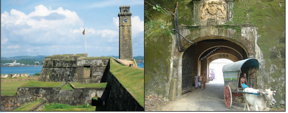
உரு 1.3 காலிக் கோட்டை

இதற்கிடையில் ஜெராட் ஹல்ப்ட் எனும் தளபதியின் கீழ் பெரிய ஒல்லாந்து கடற்படையொன்று இலங்கைக்கு வந்தது. இதனால் வலிமையடைந்த ஒல்லாந்தர், போர்த்துக்கேயரிடமிருந்து கொழும்பைக் கைப்பற்ற உயரமான இடங்களில் பீரங்கிகளைப் பொருத்திக் கோட்டையைத் தாக்கினர். தளபதி ஹல்ப்ட்டின் மீது பற்றுக் கொண்ட இராஜசிங்க மன்னன் அவனுக்கு உதவியாகப் பாரிய படையொன்றை அனுப்பிவைத்தான். இதனால் இன்னல்களுக்கு உள்ளான போர்த்துக்கேயர் அடிபணிந்து கொழும்புக் கோட்டையின் திறப்பினை ஒல்லாந்தரிடம் கையளித்தனர்.