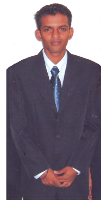
உரு 12.3 பின்கட்டிளமைப் பருவம்