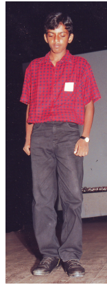
உரு 12.2 இடைக்கட்டிளமைப் பருவம்