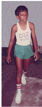
உரு 12.1 முன்கட்டிளமைப் பருவம்

அவர்களிடம் ஏற்படும் வளர்ச்சியே இந்த வேறுபாடுகள் பிரதிபலிக்கக் காரணமாகின்றது.