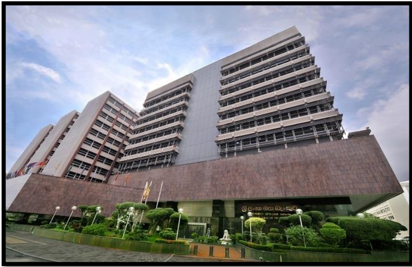
ශ්‍රී ලංකා මහ බැංකුව (Central Bank of Sri Lanka)

මෙහි ආරම්භක අධිපතිවරයා ජෝන් එක්ස්ටර් මහතාය.