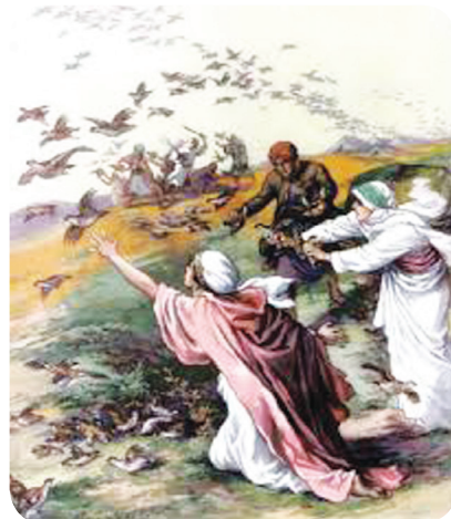
3.4 රූපය - වටුවෝ