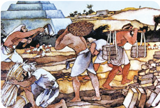
3.1 රූපය - වහලුන් ලෙස පීඩා විඳින ඉග්‍රායෙල් ජනතාව

දෙවියන් වහන්සේ විසින් තෝරාගනු ලැබූ ජනතාව වූ, පරණ ගිවිසුමේ ඉග්‍රායෙල්වරුන්ට වසර හාරසීය තිහක් මිසරයේ පාරාවෝ රජ පරම්පරාවේ වහලුන් ව සිටීමට සිදු විය. මෙලෙස මිසරයේ විප්‍රවාසී ව ජීවත් වූ ඉග්‍රායෙල් වාසීන්ගේ ජනගහනය මිසරවාසීන්ගේ ජනගහනයට වඩා ශීඝ්‍රයෙන් වර්ධනය වන්නට විය. මෙම තත්ත්වය තම දේශයේ අනාගත ආරක්ෂාවට තර්ජනයක් වන බව දුටු එවක මිසරයේ පාලක පාරාවෝ බෙහෙවින් කනස්සල්ලට පත් විය. එහි ප්‍රතිඵලයක් ලෙස ඔහු ඉග්‍රායෙල් ජනතාවට ඔරොත්තු නොදෙන තරම් බර වැඩ ගෙන ඔවුන් බොහෝ සේ පීඩාවට පත් කළේ ය. මෙම තත්ත්වය යටතේ මිසර දේශවාසීහු ද ඉග්‍රායෙල් ජනතාවගෙන් බලහත්කාරයෙන් වැඩ ගනිමින් වහල් මෙහෙය කළ ඔවුන්ගේ පීඩාව දැරිය නොහැකි තත්ත්වයට පත් කළහ.