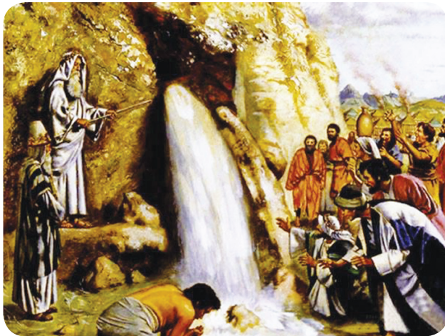
3.5 රූපය - හොරෙබ්හි පර්වතයෙන් ජලය

විමසුමට ශ්‍රී. බයිබලයෙන් නික්ම යාම 17:1-7