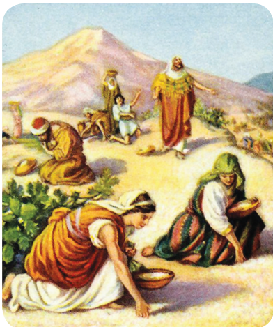
3.3 රූපය - මන්නා