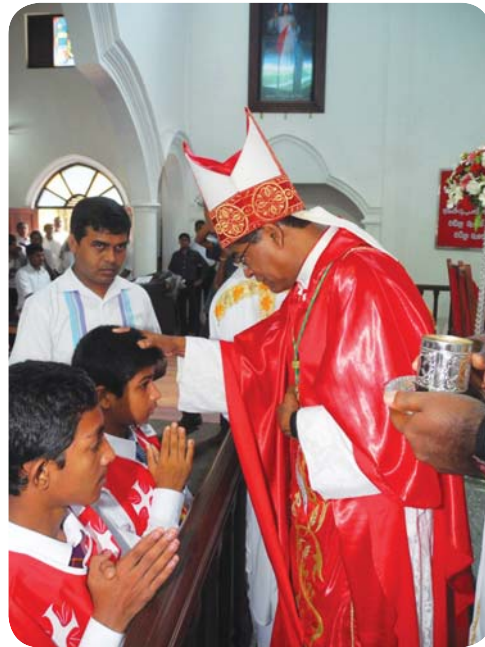
16.1 රූපය - අභිවාද්ධි ආලේපය දානය කිරීම

මෙම පින්තූරය කෙරෙහි ඔබගේ අවධානය යොමු කර, ඔබ සහභාගි වූ අභිවාද්ධි ආලේපය දානය කිරීමේ පිළිවෙතක් පිළිබඳ ව සිතියට නගා ගන්න.