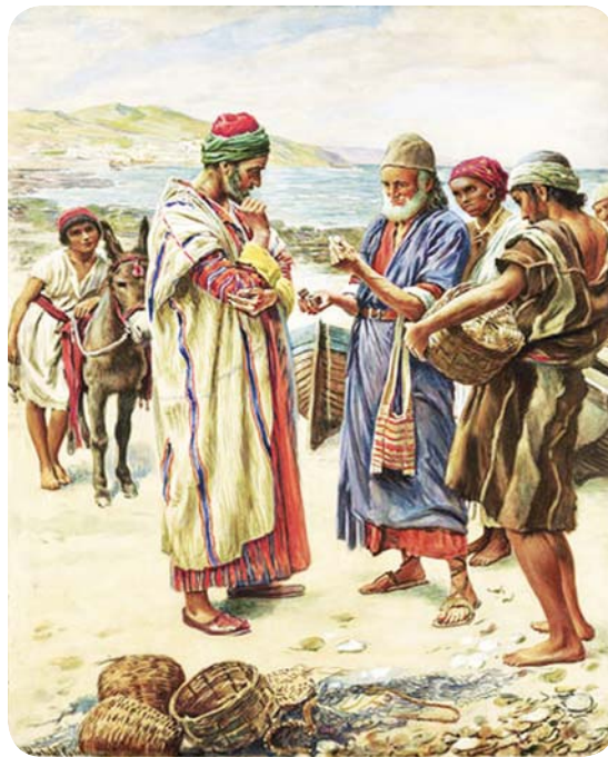
10.3 රූපය - මුතු විකුණන වෙළෙන්දා

ස්වර්ග රාජ්‍යය, අගනා මුතු සොයා ගිය වෙළෙන්දෙකුට සමාන ය. ඉතා අගනා මුතු ඇටයක් සම්බ වූ විට ඔහු ගොස් තමා සන්තක සියල්ල විකුණා එය මිලට ගත්තේ ය.