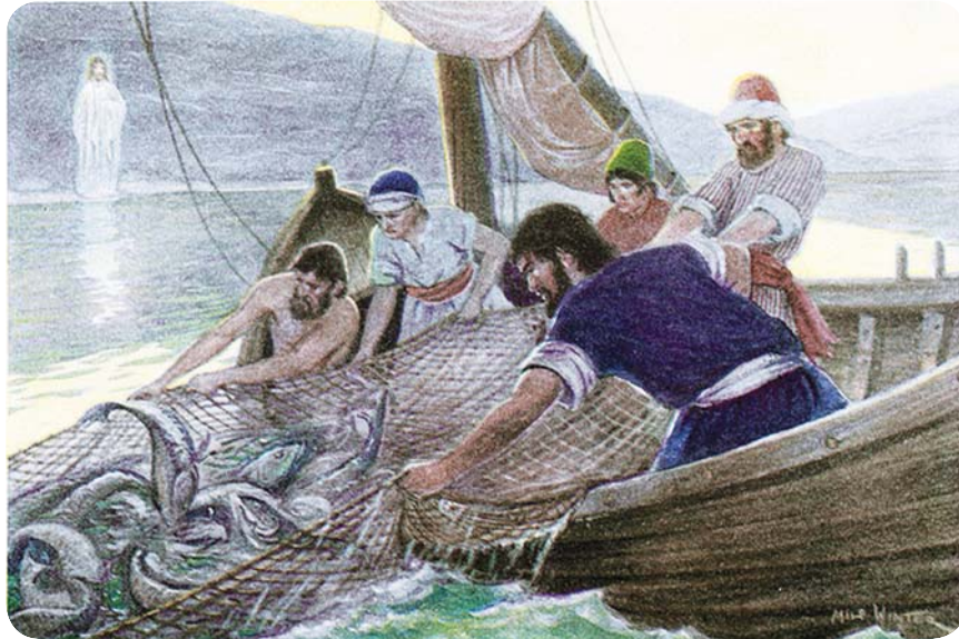
10.4 රූපය - මසුන් පිරුණු දැල

ස්වර්ග රාජ්‍යය වනාහි, මුහුදේ හෙළන ලද, සියලු වර්ගවල මසුන් හසු කර ගත් දැලකට සමාන ය. ඒ දැල පිරුණු කල, ධීවරයෝ එය වෙරළට ඇද, හිඳගෙන, හොඳ මසුන් භාජනවලට එකතු කොට නරක මසුන් ඉවත දැමූහ. යුගායන්තයේ දී එසේ ම වන්නේ ය. දේව දූතයෝ නික්ම අවුත්, දම්ටුවන් කෙරෙන් අදම්ටුවන් වෙන් කොට, අදම්ටුවන් ගිනි උදුනෙහි හෙළන්නෝ ය. එහි වැලපීම ද දත්මිටි කෑම ද වන්නේ ය.