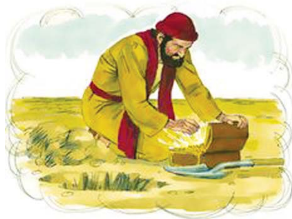
10.2 රූපය - නිධානය