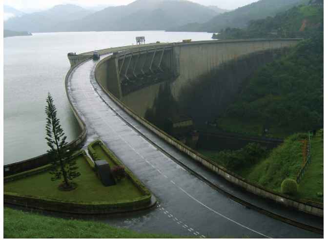
உரு 5.1 கொத்மலை நீர்த்தேக்கம்

மேற்படி நீர்த்தேக்கங்களில் பிற்பகலில் 3.00 மணி தொடக்கம் பிற்பகல் 7.00 மணி வரையில் மாத்திரம் செவுள்வலையைப் பயன்படுத்தி மீன் பிடிக்கலாம். அத்தோடு பிற்பகல் 5.00 மணி தொடக்கம் பிற்பகல் 9.00 மணி வரையிலான காலத்துள் அம்மீன்களைச் சேகரித்தல் வேண்டும். இந்த நீர்த்தேக்கங்களில் ஒருவர் ஒரு நாளில் ஒரு தடவைக்கு மேல் மீன்பிடித்தலில் ஈடுபடுதலாகாது.