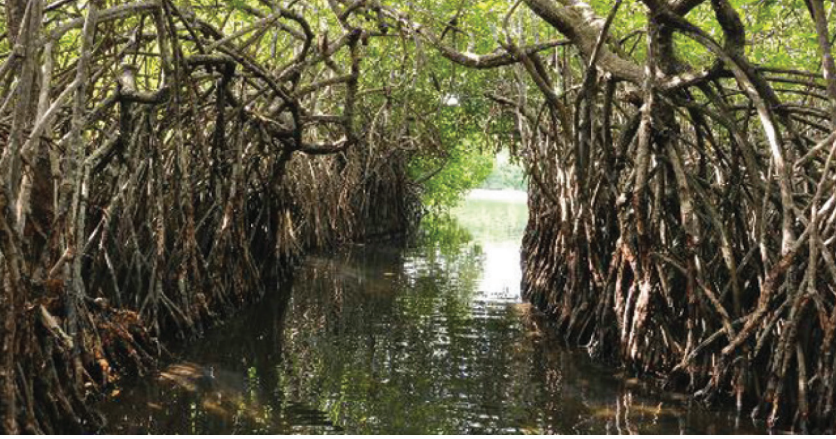
உரு 5.2 கண்டல் சூழல்