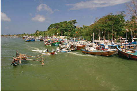
உரு 5.3 ஹிக்கடுவைக் கடனீரேரி