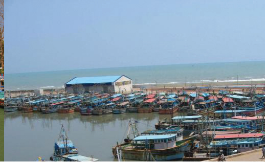
உரு 5.4 நீர்கொழும்புக் கடனீரேரி