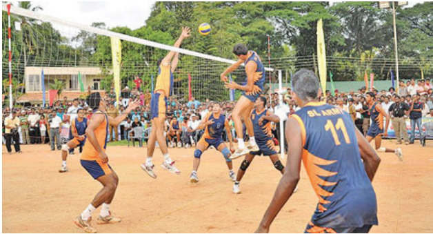
4.1 රූපය - වොලිබෝල් ක්‍රීඩාව

වොලිබෝල් ක්‍රීඩාවේ නිරත වීමේ දී වැදගත් වන ස්ථානගත වීමේ නීති රීති පිළිබඳ මෙම පාඩමේ දී අධ්‍යයනය කරමු.