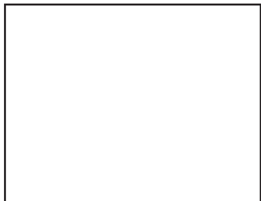
(2) වෙසක් කුඩුව