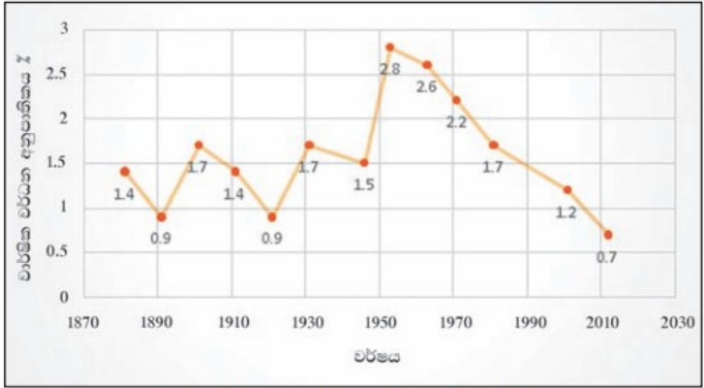
4.2 ප්‍රස්ථාරය - ජනසංඛ්‍යාවේ වාර්ෂික වර්ධන අනුපාතිකය