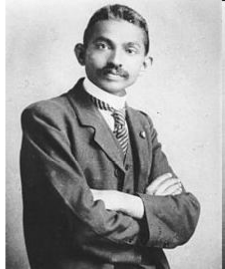
தென்னாபிரிக்காவில் காந்தி (1906)