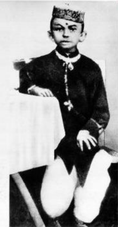
இளமையில் காந்தி (1876)

சத்தியசோதனை என்ற சுயசரிதை நூலை குஜராத்மொழியில் மாகாத்மா காந்தி எழுதினார். இந்நூல் தமிழிலும் மொழிபெயர்க்கப்பட்டுள்ளது.