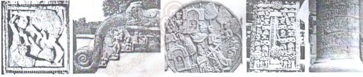
A B C D E

● 1 தொடக்கம் 5 வரையுள்ள வினாக்கள் ஒவ்வொன்றுக்கும் மிகப் பொருத்தமான விடையைக் கீழே தரப்பட்டுள்ள A, B, C, D, E ஆகிய செதுக்கல்களின் படங்களிலிருந்து தெரிவு செய்க.