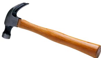
මි ..... ය