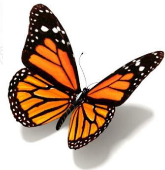
සම ..... ලයා