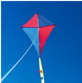
ස ..... ඟලය