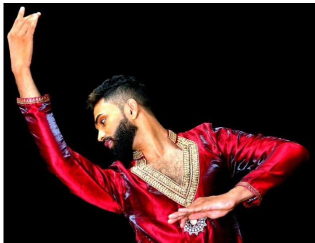
( සැ. යු. මෙහි අවසාන පින්තූරය හැර අනෙක් සියල්ලම අන්තර්ජාලයෙන් උපුටා ගත් පින්තූර වේ )