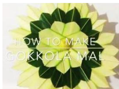
සරල පියුම කුරුල්ලා

(02) පහත ගොප් නිර්මාණ හොඳින් අධ්‍යයනය කරන්න.