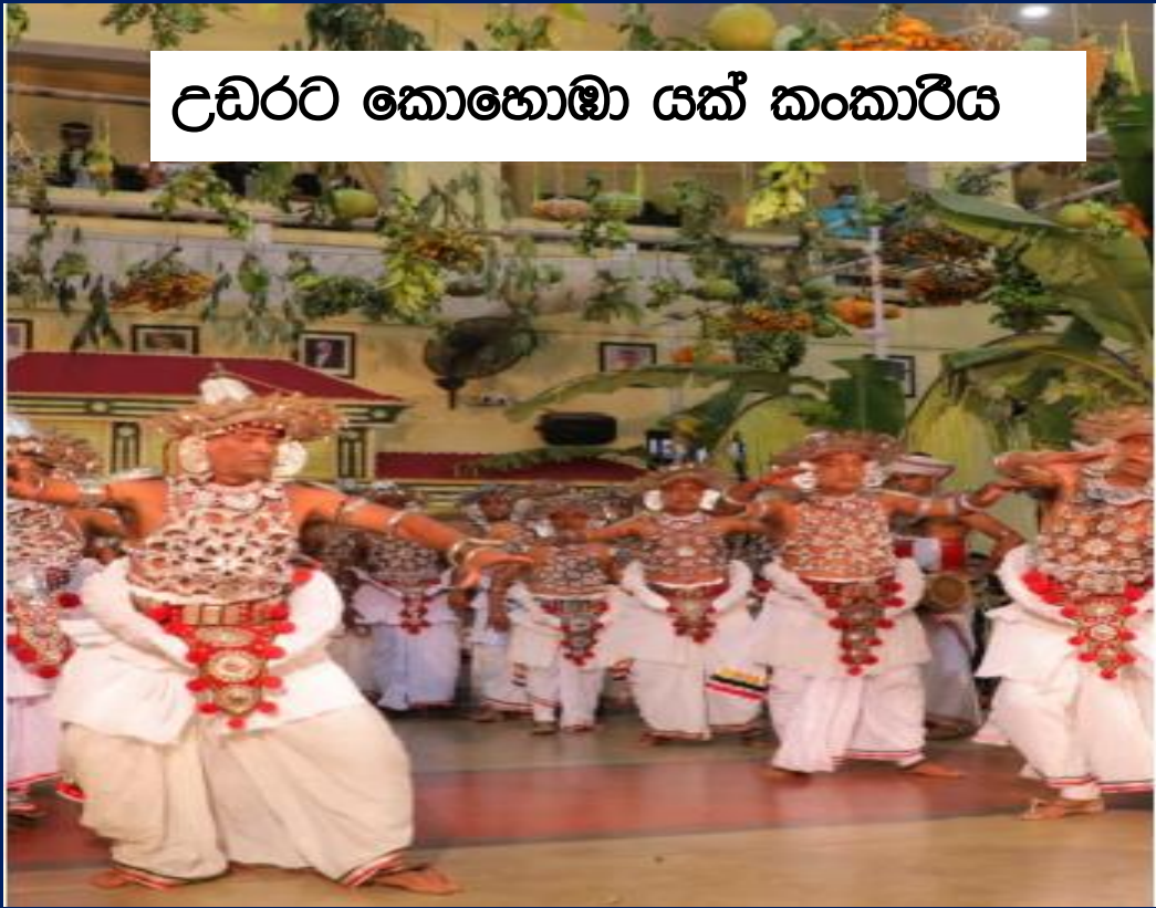
උඩරට කොහොඹා යක් කංකාරිය

සකස්කළ: ටී. කේ. ජයසේකර මහ/වත්/කෙන්ගල්ල ම.වි. මෙහෙයවීම: නර්තන අංශය වත්තේගම අධ්‍යාපන කලාපය