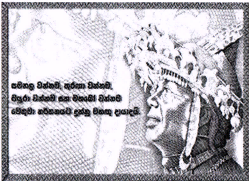
සමනල වන්නම්, තුර්කා වන්නම්, විලුරා වන්නම් සහ වලංගේ වන්නම් වේදිකා: හරිසතපති දත්ත චිත්‍ර ශාලාව

උඩරට නර්තන කලාවේ පුරෝගාමියෙකු වූ මෙතුමා 1906 දී උපත ලැබීය. නින්තෙවෙල ගුණයා ගුරුතුමා උඩරට නර්තනය ප්‍රභූ සමාජයේ අවධානයට ලක් නොවී තිබූ යුගයක තමා සතු කුසලතා ප්‍රදර්ශනය කරමින් එය සමාජයේ වටිනා කලාවක් බවට පත්කිරීමට කටයුතු කළේය. සාම්ප්‍රදායික උඩරට නර්තන කලාව ප්‍රාසංගික වේදිකාවට සුදුසු ලෙස සකස් කිරීමට පුරෝගාමියාද විය. එසේම ජාත්‍යන්තර තලයට උඩරට නර්තන කලාව ගෙන යාමට කටයුතු කල අතර, නිර්මාණකරණයට උරදෙමින් වන්නම් 18 ට අමතරව සමනල වන්නමද නිර්මාණය කරන ලදී. මේ ආකාරයට ඉටුකල මාහැඟි සේවය අගයමින් 1950 වසරේදී මෙතුමාගේ රුව ඇතුළත් තැපැල් මුද්දරයක්ද නිකුත් කර ඇත.