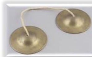
තාලම්පට ( සම්ප්‍රදායන් තුනේම භාවිතා කරයි )