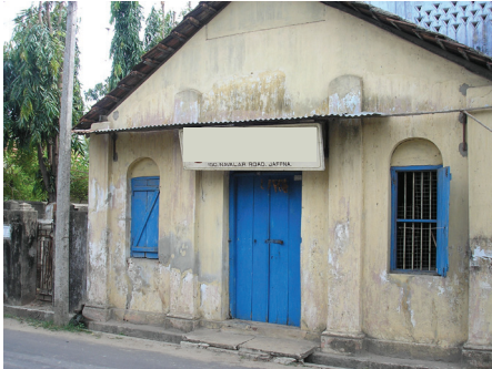
நல்லூர் வித்தியானுபாலன யந்திரசாலை

1849 இல் நல்லூரில் ‘வித்தியானுபாலன யந்திரசாலை’ என்னும் அச்சகத்தினை முதன்முதலாக நிறுவினார். அத்தோடு தமிழ்நாட்டிலுள்ள வித்தியானுபாலன யந்திரசாலை, முத்தமிழ் விளக்க அச்சக்கூடம், வாணி நிவேதன அச்சக்கூடம் என்பவற்றிலிருந்தும் நூல்களைப் பதிப்பித்து வெளியிட்டார்.