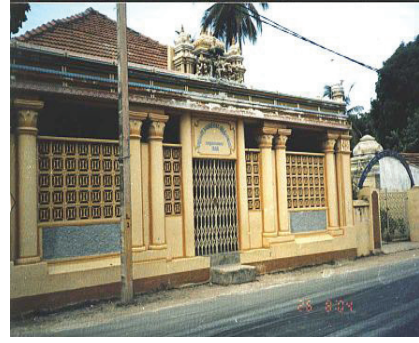
வண்ணார்பண்ணை சைவப்பிரகாச வித்தியாசாலை

அவர்களுக்கு வேதனம் வழங்கியதும் உண்டு. மேலும் சைவப்பிரசாரர்களையும், ஆசிரியர்களையும் உருவாக்கும் பொருட்டு, கல்வி நிறுவனம் ஒன்றைச் சிதம்பரத்தில் நிறுவுவதற்கு ஆசைகொண்டிருந்தார்.