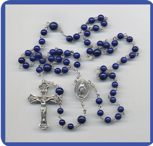
19.1 රූපය - ජපමාලය

අතිඋතුම් පස්වන පියුස් ශුද්ධෝත්තම පියතුමා ශුද්ධ වූ සභාවේ නායකත්වය දැරූ කාල වකවානුවේ දී තුර්කිය ජාතිකයන්ගෙන් ශුද්ධ වූ සභාවට තර්ජන එල්ල විය. එහෙයින් ශුද්ධ වූ සභාවේ ආරක්ෂාව සඳහා කටයුතු කරන්නැයි එතුමාණෝ යුරෝපා ජාතිකයන්ගෙන් ඉල්ලා සිටියහ. ඔව්හු ද එතුමාණන්ගේ ඉල්ලීමට ප්‍රතිචාර දක්වමින් හමුදාවක් පිහිටුවා ගත්හ. එහෙත් සටන් කිරීමට