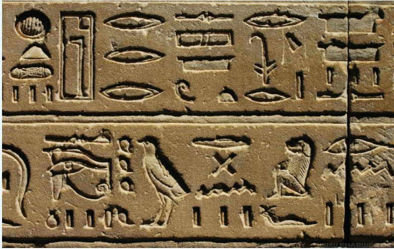
உரு 3.16 எனிப்து சித்திர எழுத்துக்கள்

எனிப்து நாகரிகக் காலத்தைச் சேர்ந்த கல்விமான்கள், எழுதுவ தற்குப் பயன்படக்கூடிய பல குறியீடுகளை உருவாக்கினர். அன்றாட வாழ்வுடன் தொடர் புடைய பல்வேறு பொருட்கள், தாங்கள் காண்பவை, தம்முடன் தொடர்புடையவை என்பனவற்றை உருவமாக வடித்து அந்தக் குறியீடுகளைத் தயாரித்தனர். இவை எனிப்து சித்திர எழுத்துக்கள் எனப் பட்டன.