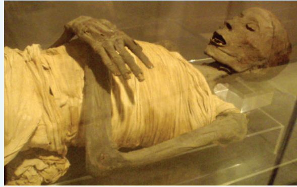
உரு 3.18 செல்வந்தர் ஒருவரின் மம்மி

இது எகிப்திய நாகரிகத்திற்குரிய செல்வந்தர் ஒருவரின் 'மம்மி' வைக்கப்பட்டிருக்கும் விதத்தைக் காட்டும் படமாகும். இறந்த உடலைப் நீண்ட காலம் பேணி வைத்திருக்கக் கூடிய 'மம்மி' முறையை எகிப்திய நாகரிக மக்களே உலகிற்கு அறிமுகம் செய்து வைத்தனர்.