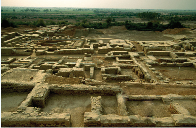
உரு 3.8 சிந்துநதி நாகரிக நகர சிதைவுகள்

சிந்துநதி நாகரிக மக்கள் செம்பு, வெண்கலம், ஈயம் மற்றும் வெள்ளியம் (Tin) போன்ற உலோகங்களை உபயோகித்தனர். அவர்கள் சுட்ட செங்கற்களைக் கொண்டு கட்டப்பட்ட வீடுகளில் வாழ்ந்தனர். அந்த வீடுகளில் மிகவும் உயர் நிலையிலான நீர்க்குழாய்த் தொகுதிகள் இருந்தன. நகரங்கள் நன்கு திட்டமிட்டு அமைக்கப்பட்டிருந்தன. இம் மக்கள் எழுத்துக்களாகப் பயன்படுத்தக்கூடிய குறியீட்டுத் தொகுதியையும் உருவாக்கினர்.