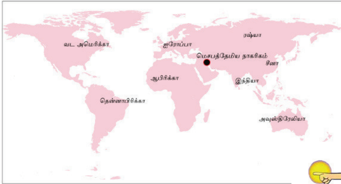
உரு 3.1 மொசப்பத்தேமிய நாகரிக பரம்பலைக் காட்டும் படம்