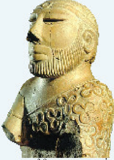
உரு 3.9 மதகுரு உருவம்

சிந்துநதிப் பிரதேசத்தில் கண்டெடுக்கப்பட்ட இந்த உருவம் அந்த நாகரிகத்தில் வாழ்ந்த மதகுரு ஒருவரின் உருவம் என நம்பப்படுகிறது. நெற்றியில் உள்ள பட்டம் அவர் உயர் நிலையிலிருந்த ஒருவர் என்பதனை வெளிப்படுத்தும் அடையாளமாகும். கண் சற்று மூடி இருப்பதானது அவர் அமைதியாகத் தியானத்தில் இருப்பதைக் காட்டுகிறது. இதன்மூலம் அவர் ஒரு மதகுரு என்பது மேலும் உறுதிப்படுத்தப்படுகிறது.