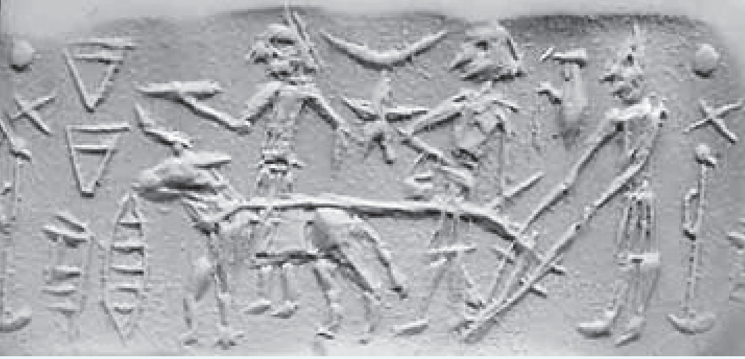
உரு 3.2 நிலத்தை உழும் விதத்தைக் காட்டும் பழைய மொசப்பத்தேமிய களிமண்தட்டு

காலப்பகுதியில் நிலவியது. அதாவது இந்த நாகரிகம் நிலவிய காலப்பகுதி இற்றைக்கு 5000 ஆண்டுகளுக்கு முன்னராகும்.