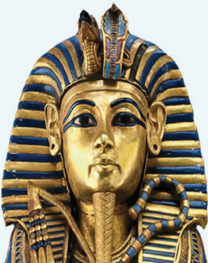
உரு 3.19 துட்டன்காமன் மன்னனின் தங்க முகமூடி கொண்ட மம்மி முகம்

இது கி. மு. 1332 - 1323 இற்கும் இடைப்பட்ட காலத்தில் இருந்த துட்டன்காமன் (டூடன் கான்) என்ற மன்னனின் மம்மியின் முகத்தின் மீது வைக்கப்பட்டிருந்த தங்கத்திலான முகமூடியாகும்.