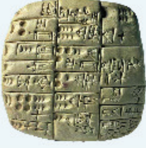
உரு 3.6 மொசப்பத்தேமிய எழுத்துத் தொகுதி

உலகில் மிகப்பழைய எழுத்துக்கலை மொசபத்தேமியாவிலேயே ஆரம்பமானது. இந்த எழுத்து 'ஆப்பு' எழுத்து எனப்பட்டது. இந்த எழுத்துக்களை எழுதுவதற்குக் களிமண்ணால் செய்யப்பட்ட தட்டுக்கள் பயன்படுத்தப்பட்டன. ஈரமான களிமண் தட்டுக்களின் மீது கூராக்கப்பட்ட குச்சி ஒன்றினைக் கொண்டு அந்த எழுத்தினை எழுதினார்கள். ஆரம்பத்தில் உருவம் வரைதல் போன்று ஆரம்பமான மொசபத்தேமிய எழுத்து முறை பிற்காலத்தில் எழுத்துத் தொகுதியாக முன்னேற்றம் அடைந்தது.