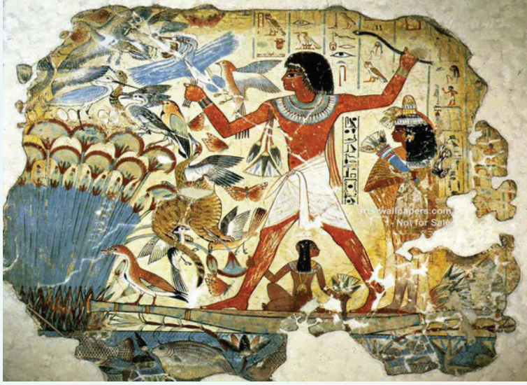
உரு 3.17 எகிப்திய சித்திரம்

இது மன்னனொருவன் பறவை களைத் துரத்திச் செல்லும் விதத்திலான பழைய எகிப்திய சித்திரம் ஆகும். சூழல் மிக அழகாக இதில் சித்திரிக்கப் பட்டுள்ளது.