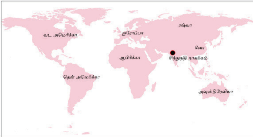
உரு 3.7 சிந்துநதி நாகரிக பரம்பலைக் காட்டும் படம்