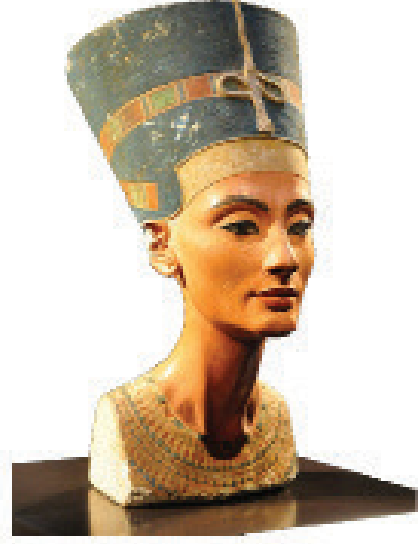
உரு 3.15 நெபநெபவுட்டேன் அரசி

நெபநெபவுட்டேன் நெபட்டிடி என்ற அரசி பாராவோ (பார்வோன்) மன்னனான அகனெட்டான் (அக்ஹெனதன்) என்பவரின் மனைவியாவாள். அவள் கி.மு. 1370 - 1330 இற்கும் இடைப்பட்ட காலத்தில் வாழ்ந்தாள். இந்த உருவின் மேற்பாகத்தைக் கொண்ட உருவம் அவள் உயிரோடு இருக்கும்போதே நிர்மாணிக்கப்பட்டதாகக் கருதப்படுகிறது. அகனெட்டான் (அக்ஹெனதன்) மன்னன் இறந்த பின்னர் சிறிது காலம் அவளால் எனிப்து ஆட்சி செய்யப்பட்டது. இந்த அரசி அக்காலத்தில் வாழ்ந்த பேரழகி எனக் கருதப்படுகிறார்.