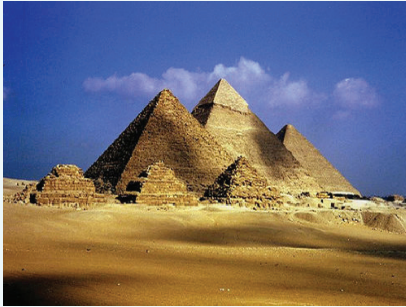
உரு 3.14 பிரமிட்டு

விவசாயமாகும். இதனால் நீர்ப்பாசனத் தொகுதி ஒன்றை அமைப்பதில் அவர்கள் சிறந்து விளங்கினர். எகிப்திய நாகரிகத்திலிருந்து உலகிற்குக் கிடைத்த சிறந்த கொடை பிரமிட்டுக்கள் ஆகும். பாராவோ மன்னர்களின் சடலங்கள் பிரமிட்டுக்களில் அடக்கம் செய்யப்பட்டன. இந்த நாகரிகத்திலிருந்து பெறப்படும் மற்றொரு முக்கிய பங்களிப்பு எழுத்துத் தொகுதியாகும். பல்வேறுபட்ட மிருகங்களினதும், பொருட்களினதும் உருவங்களைக் கொண்டு நிர்மாணிக்கப்பட்ட இந்த எழுத்துக்கள் எகிப்திய சித்திர எழுத்துக்கள் எனப் பெயர் பெறுகின்றன.