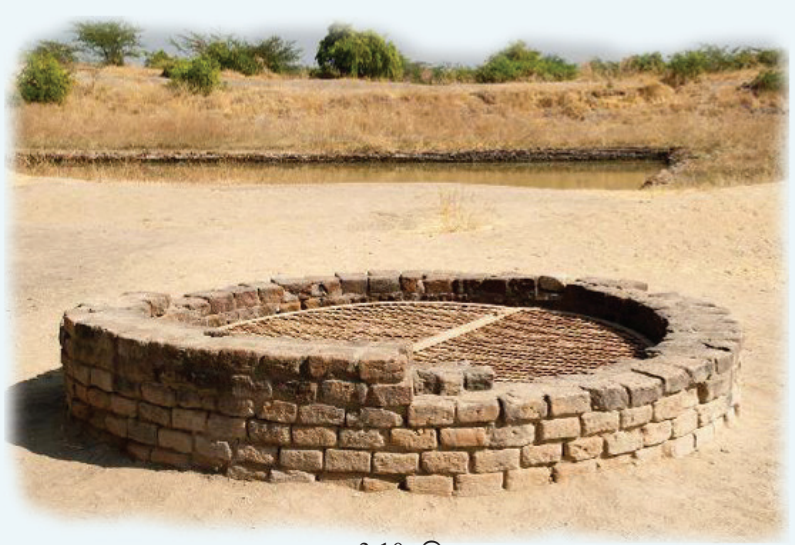
உரு 3.10 கிணறு

சிந்துநதி நாகரிக காலத்தில் நகரங்களில் வாழ்ந்த மக்கள் சிறந்த ஒழுங்கு முறையில் அமைக்கப்பட்ட கிணறு, வடிகால்கள், அழுக்குகளை வெளியேற்றும் குழாய்த் தொகுதி என்பனவற்றை உபயோகித்தனர். அவ்வாறான நகரமொன்றில் தனிப்பட்ட உபயோகத்தின் பொருட்டுக் கட்டப்பட்ட கிணறு ஒன்றே இப்படத்தில் காட்டப்படுகிறது.