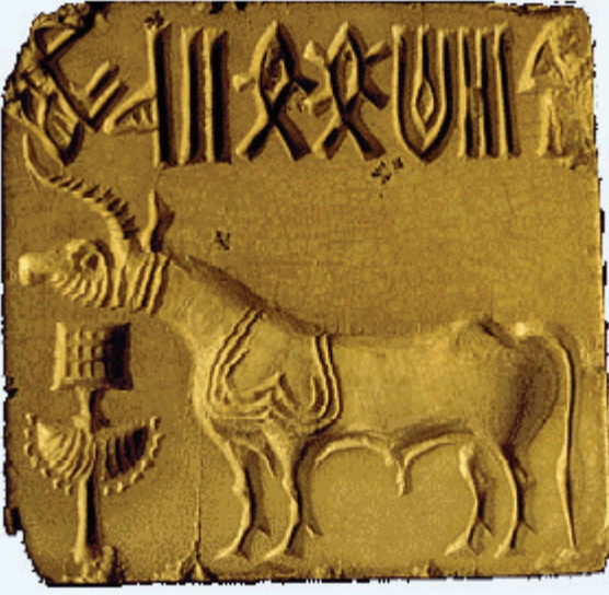
உரு 3.12 இலச்சினை

சிந்துவெளி நாகரிகத்திற்கு உரிய இலச்சினை ஒன்றே இந்தப் படத்தில் காணப்படுகிறது. படத்தின் மேல் பகுதியில் சில அடையாளங்கள் காணப்படுகின்றன. அவை ஏதேனும் கருத்தினை வெளிப்படுத்தப் பயன்படுத்திய சிறப்பான எழுத்துக்கள் எனப் பலர் கருதுகின்றனர். படத்தில் காணப்படும் மிருகம் காண்டாமிருகம் (ரானோசிரஸ்) என்பதில் சந்தேகமில்லை. சிந்துநதி நாகரிகத்திற்குரிய இலச்சினைகளில் என்ன எழுதப்பட்டுள்ளன என்பதனை இதுவரை எவரும் அடையாளம் காணவில்லை.