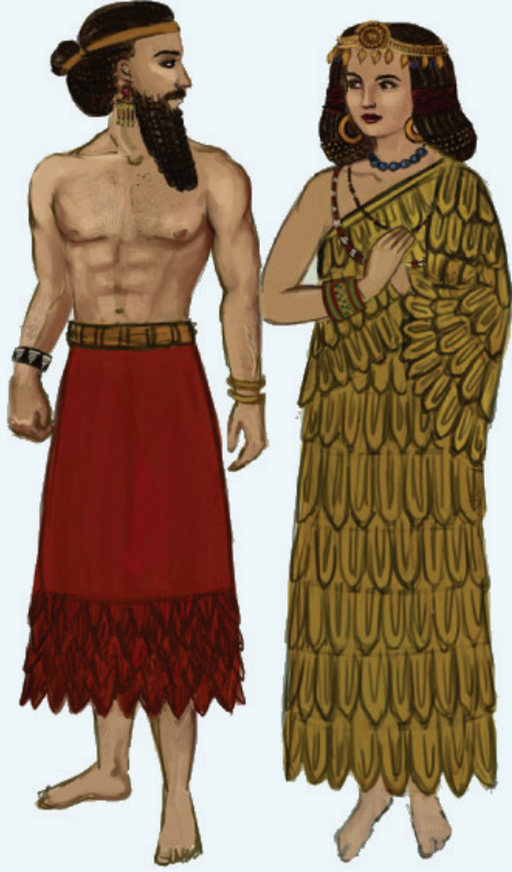
உரு 3.5 மொசப்பத்தேமிய உயர்குடி ஆண், பெண் தோற்றம்