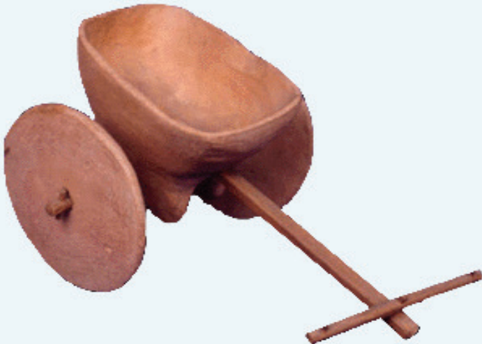
உரு 3.11 விளையாட்டு மண் வண்டி

சிந்துநதி நாகரிகத்தைச் சேர்ந்த பழைய நகரங்களில் காணப்படும் நன்கு அமைக்கப்பட்ட வீதிகள் போக்குவரத்து அடைந்திருந்த முன்னேற்றத்திற்கு சிறந்த சான்றாகும். அவ்வாறு பயன்படுத்தப்பட்ட வண்டியொன்றின் உருவமே இங்கு காணப்படுகிறது. விளையாட்டின் பொருட்டு இது பயன்படுத்தப்பட்டதாக இருக்கலாம்.