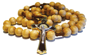
17.3 රූපය - ශුද්ධ වූ ජපමාලය