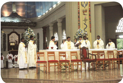
17.1 රූපය - ශුද්ධ වූ දිව්‍ය යාගය