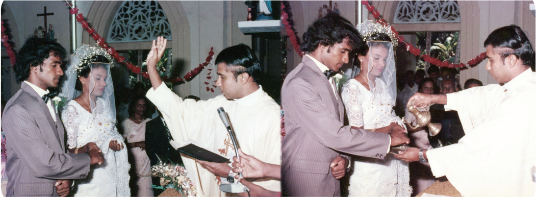
15.1 රූපය - ආශීර්වාදකාර බන්ධන පිළිවෙත

“දෙවියන් වහන්සේ එක් කළ අය මනුෂ්‍යයා වෙන් නොකෙරේවා!