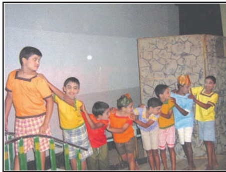
(හඬ නතර වෙයි. දුම්රිය ඉදිරියට යන බව හැඟෙන සේ ළමයින්ගේ ඉරියව් වෙනස් වෙයි.)

නාට්‍ය රචකයාගේ කාර්යය වන්නේ නාට්‍ය පෙළ හෙවත් පිටපත සකස් කිරීම ය. නාට්‍යයේ පදනම එයයි. වචන උච්චාරණය කිරීමේ දී හඬ උස් පහත් කරන ආකාරය විරාමය (නැවතීම) ආදිය හැමෙකක් ම නැතත් සමහර අංග පෙළෙහි දැක්විය හැකි ය. ආත්ම භාෂණයේ යෙදෙමින් ‘තමාට ම’ යනුවෙන් දක්වන්නේ එබඳු තැන් ය.