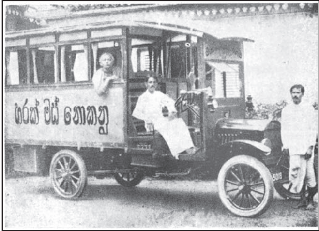
අනගාරික ධර්මපාලතුමා සංචාරය කළ රථයේ ඡායාරූපයක්

ගත්තේ ය. එමෙන් ම බුන්මවාරි ජීවිතයක් ගත කිරීමට සිතා ගත් එතුමා අනගාරික ධර්මපාල නමින් ප්‍රසිද්ධියට පත්විය. මෙතුමාගේ මෙම ආදර්ශය හේතු කොට ගෙන විදේශ නම් වෙනුවට සිංහල නම් භාවිතයට සමහරෙක් යොමු වූහ. දේශීය පැරණි සිරිත්විරිත්වලට ගරු කිරීමට සිංහල ජනතාව පිබිදවූයේ ද අනගාරික ධර්මපාලතුමා ය. එතුමා යුරෝපීය ඇඳුම් අතහැර අන්‍යයන්ට පූර්වාදර්ශයක් වී දේශීය ඇඳුමට ජනතාව යොමු කළේ ය. තම මවට ඔසරිය අන්දවා, සාය බොස්තොරොක්ක වෙනුවට ඔසරිය ඇඳීමට සිංහල කාන්තාවන් යොමු කළේ ය.