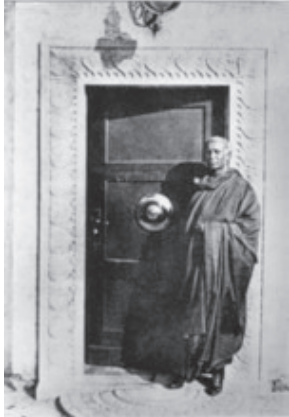
අනගාරික ධර්මපාලතුමා පැවිදි බිමට ඇතුළත් වූ පසු

මුළු ජීවිත කාලය ම ජාතික හා ආගමික සේවය සඳහා කැප කළ මෙම යුග පුරුෂයා වර්ෂ 1931 දී මවුබ්මෙන් සමුගෙන ඉන්දියාවට ගොස් බරණැස ඉසිපතනයේ ආරම්භ කරන ලද මූලගන්ධකුටි විහාරයේ දී ‘සිරි දේවමිත්ත ධර්මපාල’ නමින් පැවිදි බිමට ඇතුළත් විය. පැවිදි වීමෙන් දෙමසකට පසු ව උපසම්පදාව ලැබූ උන්වහන්සේ වර්ෂ 1933 අප්‍රේල් මස 29 වෙනි දින “සම්බුදු සසුන පතළ කරනු පිණිස යළි යළිත් උපදීම” යි පතමින් සිහිනුවණින් යුතු ව අවසන් හුස්ම හෙළාහ. මෙතුමා අවංක ජන නායකයෙකි. බුදු දහම ලක්දිව හා ලෝකයේ ව්‍යාප්ත කිරීමට කටයුතු කළ ශ්‍රේෂ්ඨ ධර්ම දූතයෙකි. අධිරාජ්‍යවාදීන් ඉදිරියේ නොබිය ව ක්‍රියා කළ නිර්භීත ලාංකිකයෙකි. ලොවට මෙසේ විශාල සේවයක් කළ අනගාරික ධර්මපාලතුමාගේ නාමය සද අමරණීය වේ.