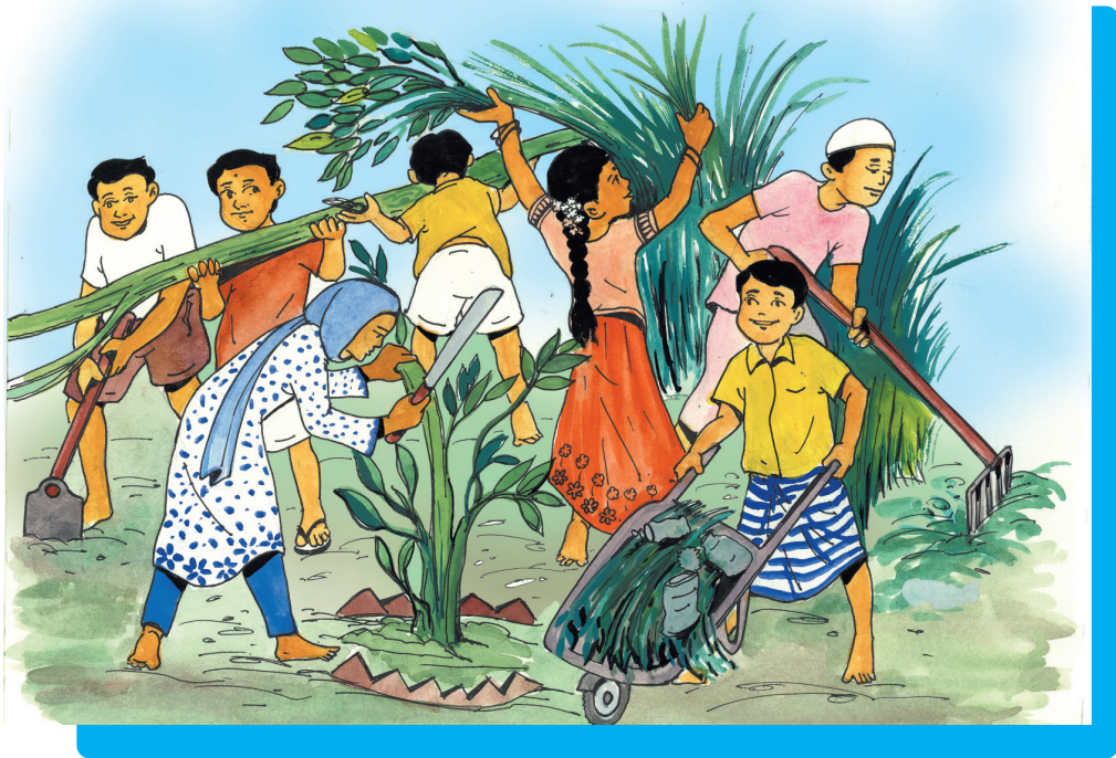
එක මවකගෙ දරු කැළ ලෙසිනා

බෞද්ධ ජන සමාජය සැමට සේවය කරමින් ආදර්ශ සම්පන්න වීමට හේතුව මෙම ඉගැන්වීම් බව මට සිතේ. කුලහේදයේ කුලවාදයේ ඇති නිරර්ථක බව දැක්වීමට බුදුරජාණන් වහන්සේ දේශනා කර ඇති වාසෙට්ඨ සූත්‍රය ද මට කිසි දු අමතක නො වේ. කුල වශයෙන්, පන්ති වශයෙන්, ජාති, ආගම් වශයෙන් මිනිසා උසස් පහත් නො වන බව සලකා සමානාත්මතාවෙන් යුතු ව බෞද්ධ සහෝදරයන් කටයුතු කරන්නේ බුදු දහමේ එන ඉගැන්වීම් නිසා ය.