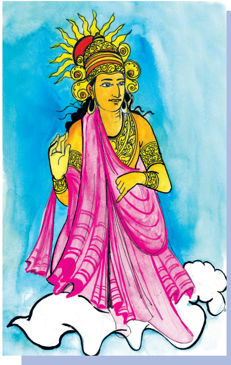
කළ පින් බලෙන් දෙවිලොව ඉපිද

අකුසල කර්මයට ද හානි කරයි. ජනක කර්මයාගේ විපාක දීමේ හැකියාව නැති කොට තමා ම විපාක ලබා දෙන කර්මය උපසාහක නම් වේ. උපසාහක අකුසල කර්ම ජනක කුසල කර්මයේ ද උපසාහක කුසල කර්ම ජනක අකුසල කර්මයේ ද විපාක දීමේ ශක්තිය නැති කරයි.