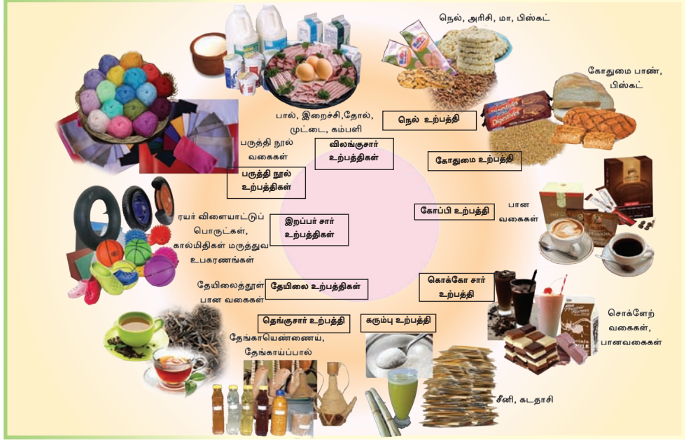
உரு 3.1 விவசாயப் பயிர்களுடன் தொடர்பான உற்பத்திகள்