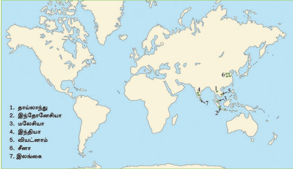
படம் 3.4 உலகில் இறப்பர் பயிர்ச்செய்கை நடைபெறும் நாடுகள்

பிறேசிலில் ஒரு காட்டுப் பயிராகக் காணப்பட்ட இறப்பர் பின்னர் படிப்படியாக விரிவடைந்து பெருந்தோட்ட விவசாயத்தின் கீழ் வளர்ச்சியடையும் ஒரு பயிராகத் தெற்கு, தென் கிழக்கு ஆசியா மற்றும் ஆபிரிக்க நாடுகளில் பரவியது. 1890 களில் ஐரோப்பாவில் ஏற்பட்ட மோட்டார் வாகனக் கைத்தொழில் அபிவிருத்தி காரணமாக இறப்பருக்கான கேள்வி படிப்படியாக அதிகரித்தது. 20ஆம் நூற்றாண்டு அளவில் பெருந்தோட்ட விவசாயத்தின் கீழ் பயிராகும் பயிர்களில் தேயிலைக்கு அடுத்ததாக இறப்பர் இரண்டாம் நிலையில் இருந்தது. இன்று, உலக இயற்கை இறப்பரின் மொத்த உற்பத்தியில் 95 சத வீதமானது தெற்கு மற்றும் தென் கிழக்கு ஆசிய நாடுகளில் உற்பத்தி செய்யப்படுகின்றமை குறிப்பிடத்தக்கது. உலகில் இறப்பர் பயிர்ச்செய்கை இடம்பெறும் நாடுகள் சிலவற்றை படம் 3.4 இல் காணலாம்.