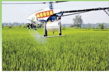
உரு 3.4 உரங்களை விசிறல்