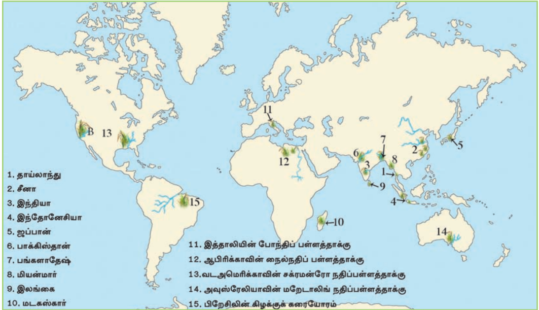
படம் 3.1 உலகின் பிரதான நெல் உற்பத்திப் பிரதேசங்கள்