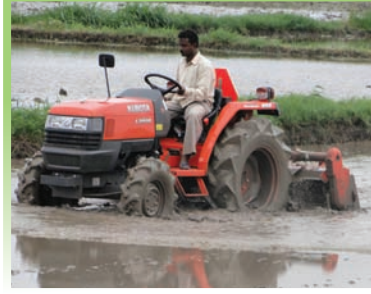
உரு 3.3 நிலத்தினை உழுதல்