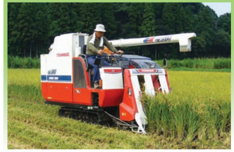
உரு 3.5 அறுவடை செய்தல்

நெற் பயிர்ச்செய்கையில் நவீன இயந்திரங்களின் பயன்பாடு