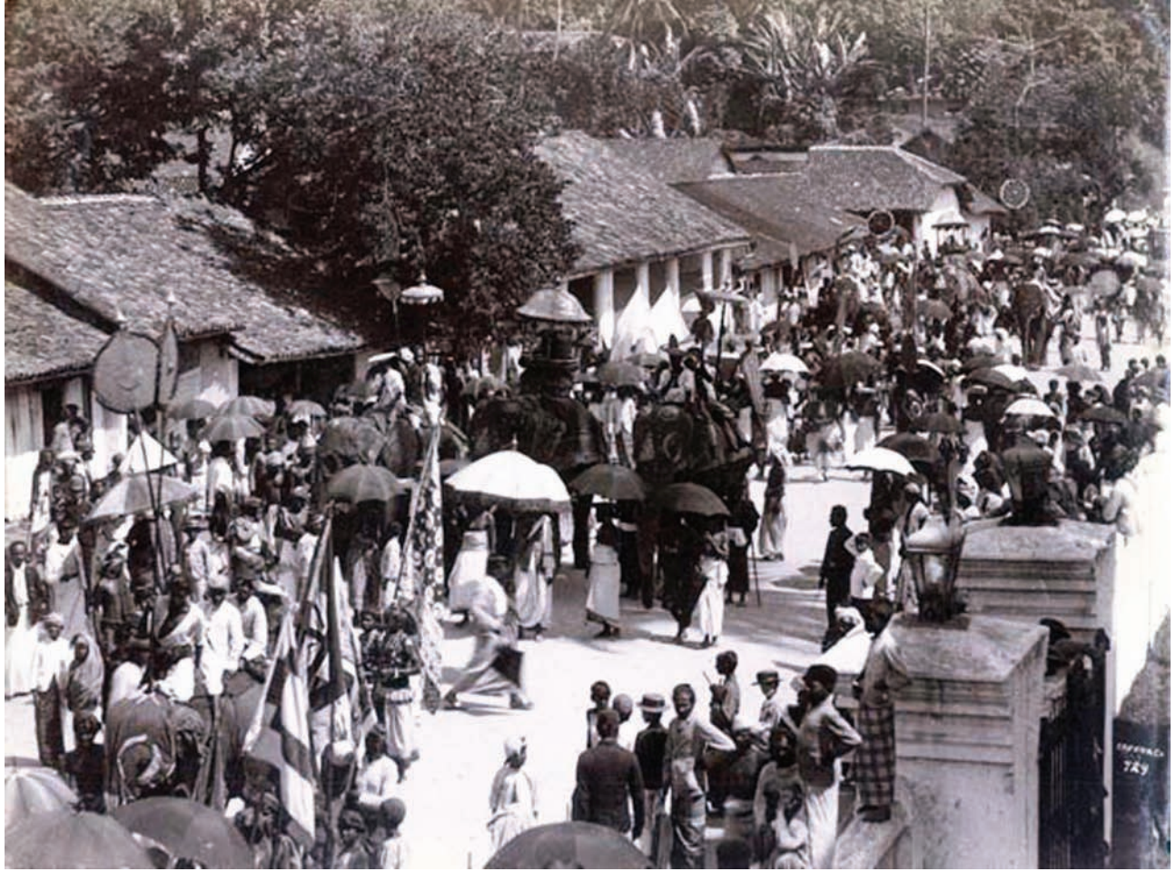
உரு. 8.2. பத்தொன்பதாம் நூற்றாண்டில் கண்டி தலதா மாளிகையின் பெரஹுவையும் (ஊர்வலமும்)கண்டி நகரின் வீதிகளின் தோற்றத்தையும் காண்பிக்கும் அபூர்வமான படம்.

கரையோரத்திலிருந்து முற்றாக வெளியேற்றினான். ஆனால் அவற்றை ஒல்லாந்தர் தமதாக்கிக் கொண்டனர். பின்னர் தமது ஆட்சிப் பரப்பை விஸ்தரித்துக் கொள்வதில் ஒல்லாந்தர் கவனஞ் செலுத்தினர். கி.பி. 1665 - 1668 ஆம் ஆண்டுகளில் ஒல்லாந்தர் கண்டி இராச்சியத்தின் சில பிரதேசங்களைக் கைப்பற்றிக் கொண்டனர். அப்போது அமைதியாக இருந்த இராஜசிங்கன், கி.பி. 1670 - 1675 ஆண்டுகளுக்கு இடைப்பட்ட காலத்தில் ஒல்லாந்தருக்கு எதிராகப் பல தாக்குதல்களை மேற்கொண்டு, அவர்கள் வசமிருந்த பல பிரதேசங்களை மீட்டுக் கொண்டான். இதன் மூலம் கண்டி இராச்சியத்தின் பலத்தைப் புரிந்து கொண்ட ஒல்லாந்தர், அதிலிருந்து மன்னருடன் ஒற்றுமையாகச் செயற்பட ஆரம்பித்தனர்.