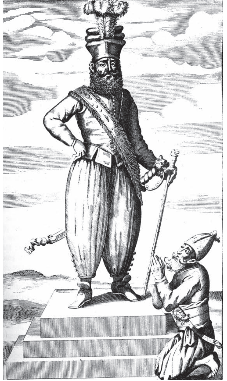
உரு 8.1. இரண்டாம் இராஜசிங்க மன்னரின் தோற்றத்தைக் காட்டும் சித்திரம். இது கண்டி இராச்சியக் காலத்தில் இங்கு சிறைப்பட்டிருந்த ரொபட் நொக்ஸ் என்ற ஆங்கிலேயரால் வரையப்பட்டதாகும்.