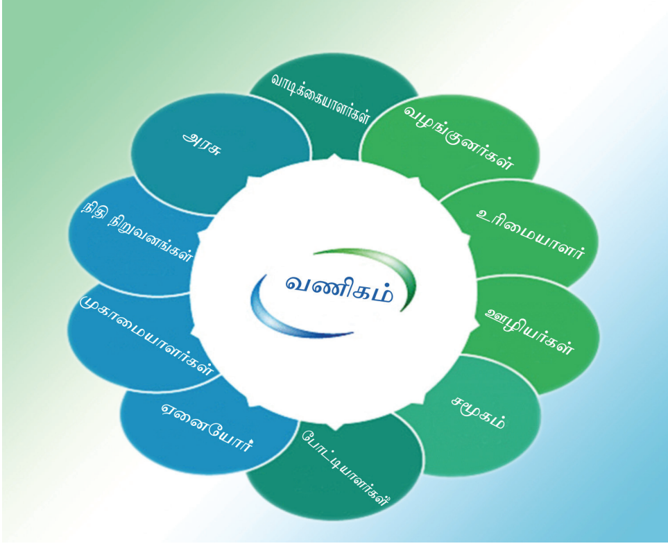
படம் 1.5 வணிகமொன்றின் மீது அக்கறை செலுத்தும் பிரிவினர்

மேற்காட்டப்பட்ட படத்தில் காணப்படும் அக்கறை செலுத்தும் பிரிவினர் தொடர்பாக அறிந்து கொள்வோம்.